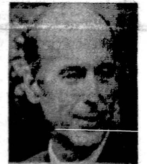
Valery Giscard d'Estaing

Kas reiktų daryti, jei komunistai tikrai įsigalėtų Romoje? Atsakymas: nieko. Bent prancūzai laikosi tradicijos nesikišti į kitų šalių vidaus reikalus. Klaidą padarytų ir Amerika, jei jį ką darytų. Bet būtų normalu, minė sistemą. Jie nėra paruošti privaliai, laisvų verslų praktikai. Tai dar nereiškia, kad jie ateity nebus mums draugiški.