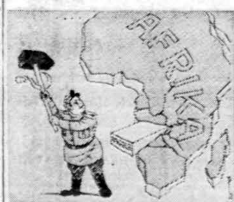
"Divide et impera" — skaldyk ir valdyk, arba Maskva Afrikos "vieinytojo" vaidmeny (iš vokiečių spaudo)

Sen. Harry Byrd (nepriklausomas, Va.) po to sakė, kad Kissingeris jo vardą Afrikoj minėjo visą laiką, nes jis, senatorius, ir buvo ano įstatymo, draudžiančio boikotuoti Rodeziją, autorius. Jis apkaltino Fordo administraciją "intelektualiniu negarbingumu" ir hipokrizė. Dabartinė Amerikos politika Afrikos atžvėgiu yra "glėbėsčiavimas su komunistine Rusija".