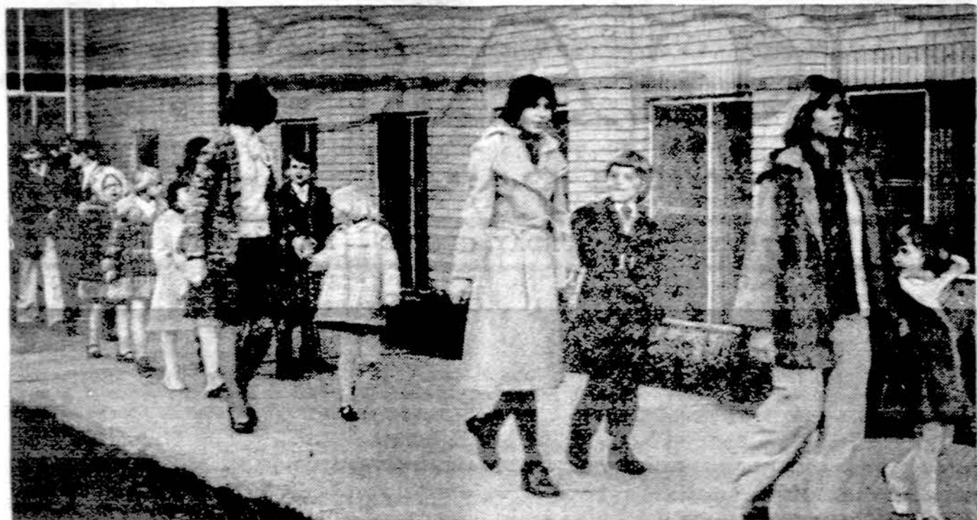
Chicago jaunesnieji ateitininkai, savo vadovų-globėjų vedami, vyksta į bažnyčią.