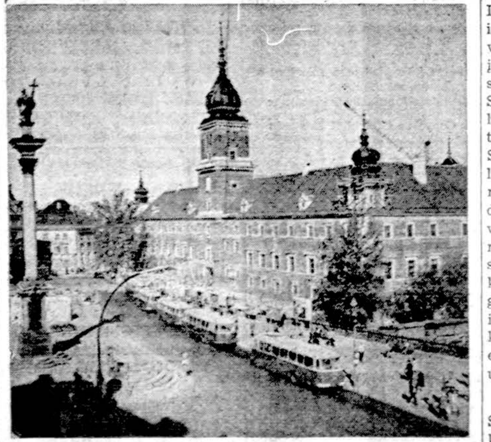
Varšuva. Baigiami atstatyti XIV amžiaus pilies rūmai, II pasaulinio karo metu vsai sunaikinti. Šiuose rūmuose gyveno vėlesnieji Lietuvos Didieji kunigaikščiai, būdami kartu ir Lenkijos karaliais. Kaišėje žymiausias miesto paminklas, 1643 pastatyta Žigimantui III Vazai kolona, taip pat karo metu nugriauta ir 1949 atstatyta

Bruselis. — Apie 50 arabų studentų buvo užėmę Sirijos ambasadą Briusely ir ilgai ją laukė, protestuodami dėl Sirijos politikos Libano atžvilgiu.