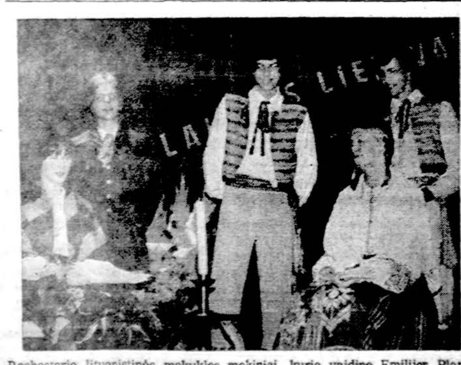
Rocheaterio lituanistinės mokyklos mokiniai, kurie vaidino Emilijos Platraitės sukilimo kovas su rusais 1831 m.

— Daktare, — pasakė jis, — bet tas galėjo ir įvykti. Visi stikliukai buvo vienodi, o kai kurie žmonės buvo jau gerokai išgėrę vyno. Aš per daug nebūčiau nustebintas, jei kuris iš jų per apsirikimą ir išgėrė ligojimo šlapumą. — Daktare, — pasakė jis, — bet tas galėjo ir įvykti. Visi stikliukai buvo vienodi, o kai kurie žmonės buvo jau gerokai išgėrę vyno. Aš per daug nebūčiau nustebintas, jei kuris iš jų per apsirikimą ir išgėrė ligojimo šlapumą.