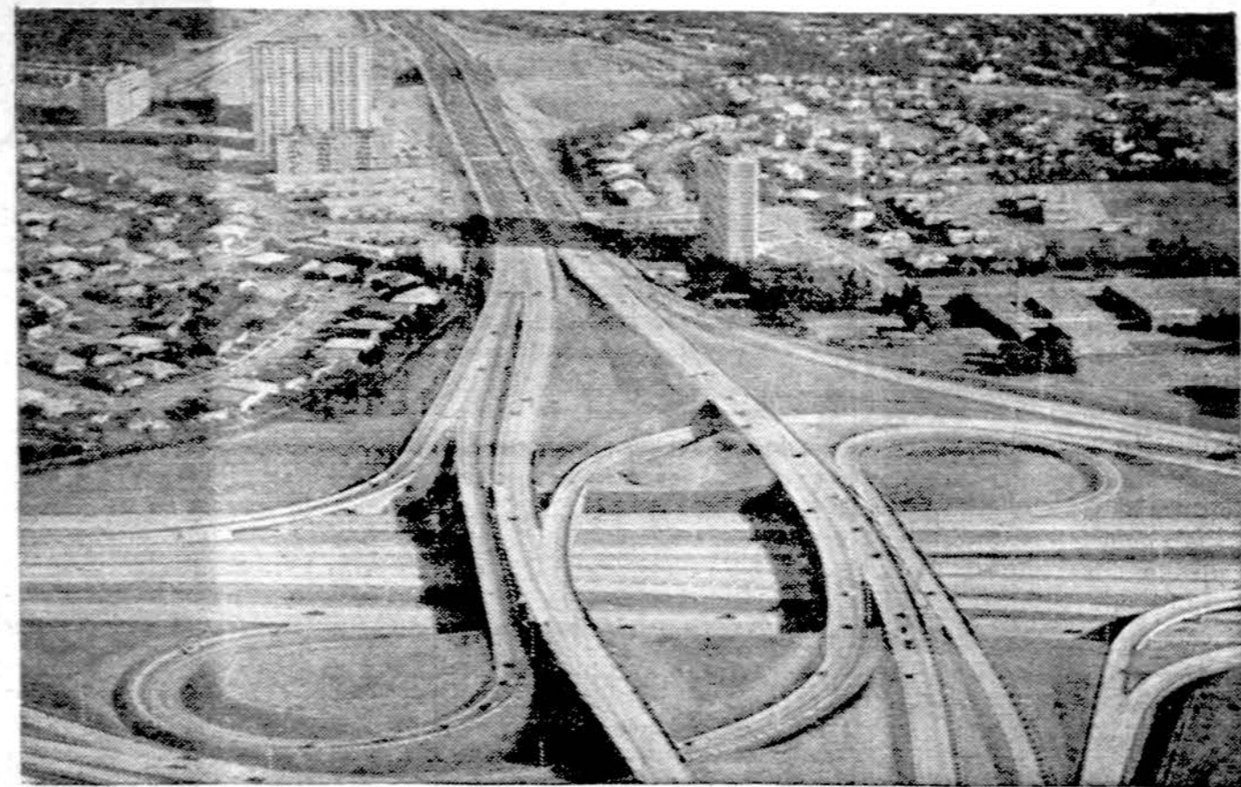
Kelių mazgai ties Toronto, Kanadoje.

katą, tik kitais žodžiais pakartoto seną giesmę. Jugoslavai tuoj pat atsakė ne. Korespondentui vadovaujantieji partijos asmenys tvirtino, jog "internacionalizmo" formulės supratimas turi būti užmirštas. Prieš aštuonerius metus toji formulė leido padaryti ginkluotą intervenciją į Čekoslovakiją. "Jokio kompromiso su internacionalizmu", sako jugoslavai.