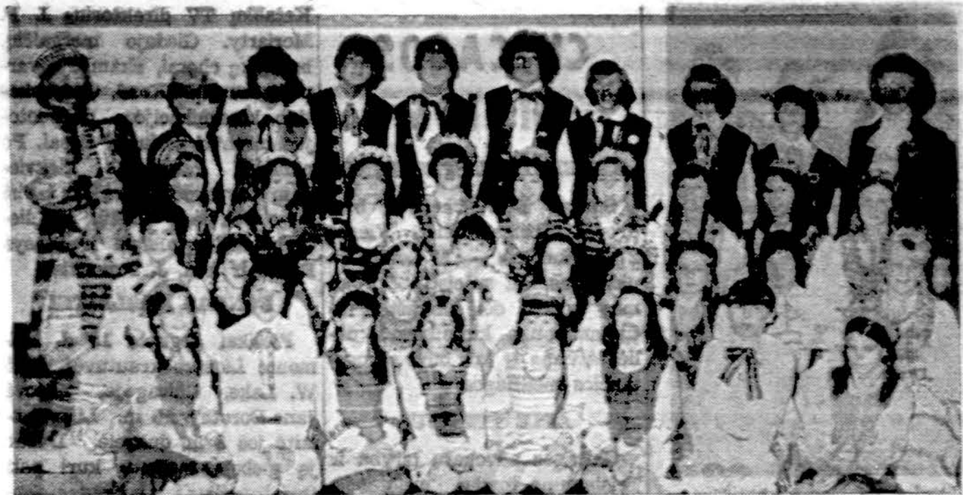
Omahos tautinių šokių grupė "Aušra" su savo vadovėmis.