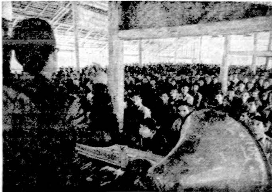
"Perauklėjimo" stovykla Truong Cuan-Huan Pietų Vietnamo kariams, kur komunistų politiniai vadovai skelbia naują "tikėjimą".