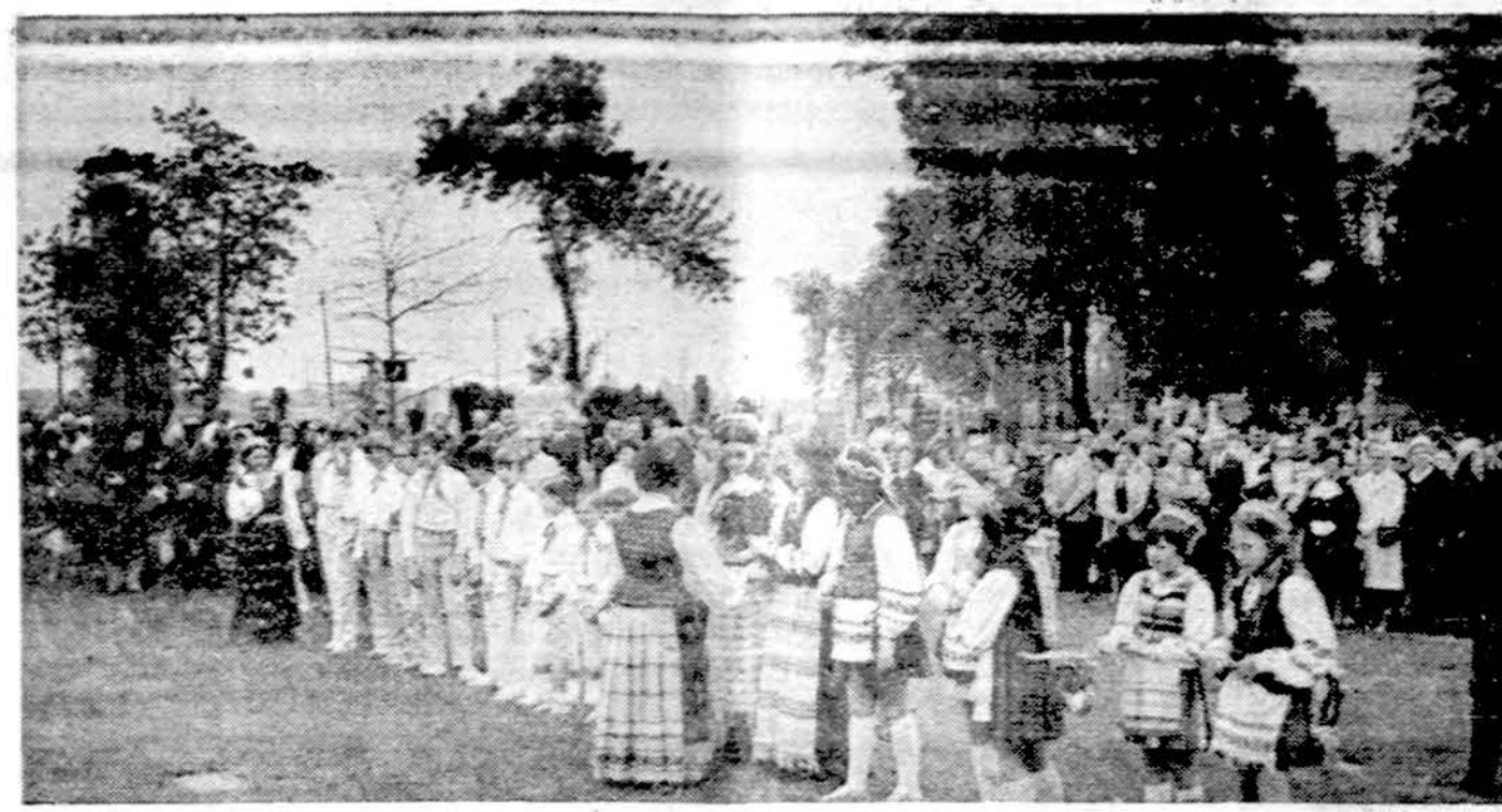
Vaidzas iš iškilnių kapų puošimo dieną Chicagoje Lietuvių šv. Kazimiero kapinėse.

Chicago ligoninėms vasaros mėnesiais — biržely, liepos ir rugpjūtį — reikės apie 60,000 vienetų kraujo perliejimams ligoninėse. Nors paskutiniu metu kraujo aukojimas pagausėjo, bet dar bus trūkumas. Ieškoma daugiau aukotojų.