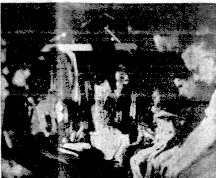
A prisoner's prayer! Catholic Lithuanians in Siberian prison camps participate in moments of silent prayer, early in the morning at 4:30 A.M. before the Soviet guards have awakened.

Principiniai Fordas pasisakė prieš bet kurio krašto intervenciją į Libano vidaus reikalus. Sirijos įsikūsimas, jo žodžiais, buvęs riboto pobūdžio.