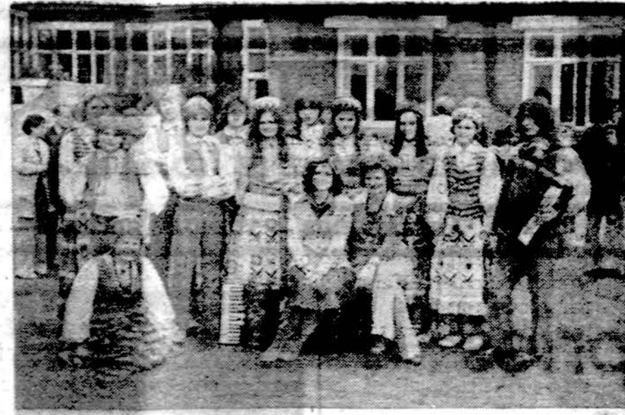
Londono (Anglijoje) lietuvių tautinių šokių grupė