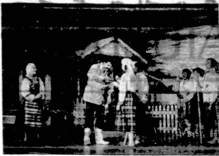
Vaidžais iš Baltimorėj pastatytos Rugiaplūtės.