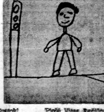
Piešė Vasa Ruzičius, Dariaus Girėno lit. m-los 3 sk. mokinė

Vasario 16 yra Lietuvos Nepriklausomybės šventė. Lietuva atgavo savo nepriklausomybę vasario 16, 1918 m. Anksčiau Lietuva priklausė rusams, lenkams ir vokiečiams. Po nepriklausomybės pasirašymo lietuviai galėjo patys save valdyti. Vaikai galėjo skaityti ir rašyti lietuviškai. Žmonės