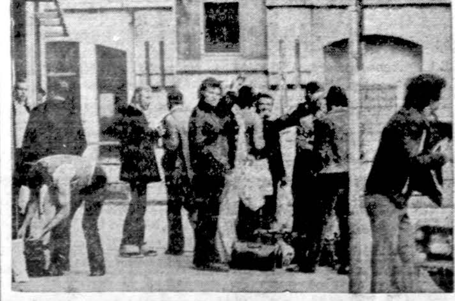
Pokario metais Vakarų Vokietijoje dirba daug užsienio darbininkų. Dar- bų pradeda mažėti, ir daugelis užsieniečių priversti grįžti į savo kraštus. Nuotraukoj turkai važiuoja namo.