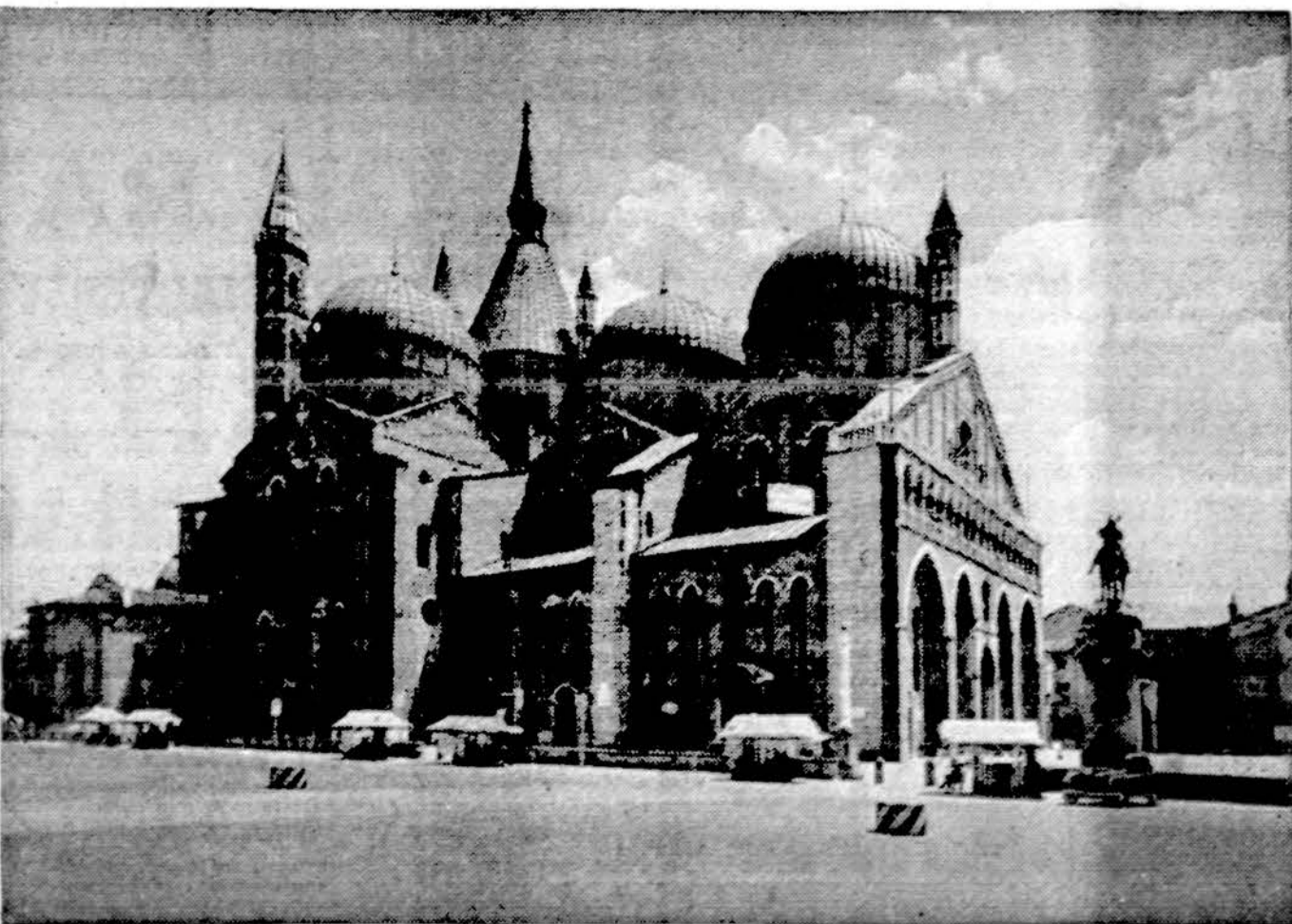
Padova. Šv. Antano bazilika, kurioje laikomas šventojo karstas

2. Australija viską darys, kad palaikytų geriausius santykius su tradiciniais draugais, ypatin-gai Amerika ir Japonija; 3. Buvusio premjero rekomendacija Indijos vandenyną laikyti "taikos zona" buvusi ne-reali, akivaizdoje sovietų grėsmės ir jos bazių steigimo Afrikos žemyne prie to paties vandenyno, todėl Australija yra už Australija nepripažįsta tų valstybių inkorporavimo; 4. Valstybės gynybas Whitlam laikais buvo virtęs antraeile problema, dabar ji vėl statoma pirmon vieton. Buvusio premjero buvo sustabdyta laivų naikintojų ir greitlaivių statyba, karo mokykla buvo panaikinta. Toji programa dabar atgaivinta. Fraser premjeru pasidarė lygiai prieš pusmetį.