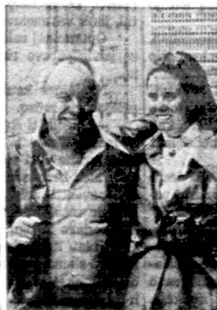
Amerikietis rašytojas Leon Uris su žmona Anglijoje, kur ruošia naują knygą.