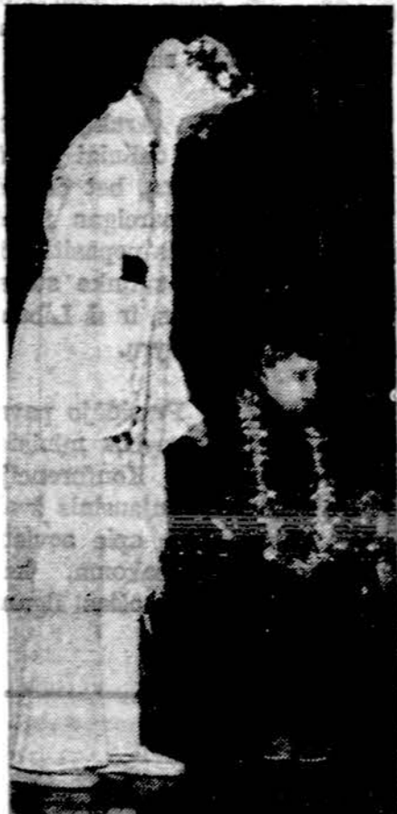
Jaunūčiai vaidina Chicagoje