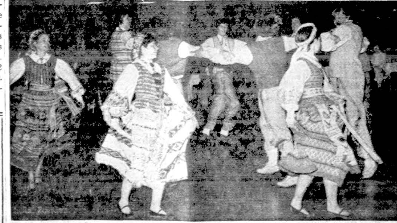
Grandies šokėjų atlikta programą Cicero lietuvių Bicentennial minėjime birželio 20 d. 12 v. Roosevelt mokyklos auditorijoje.

DRAUGAS, Knygų skyrius 4513 West 63rd Street Chicago, Illinois 60629 Kaina $3.50. Pridėkite 30 centų pašto išlaidoms. Illinois gyventojai pridėkite 50 centų mokesčiams ir paštui.