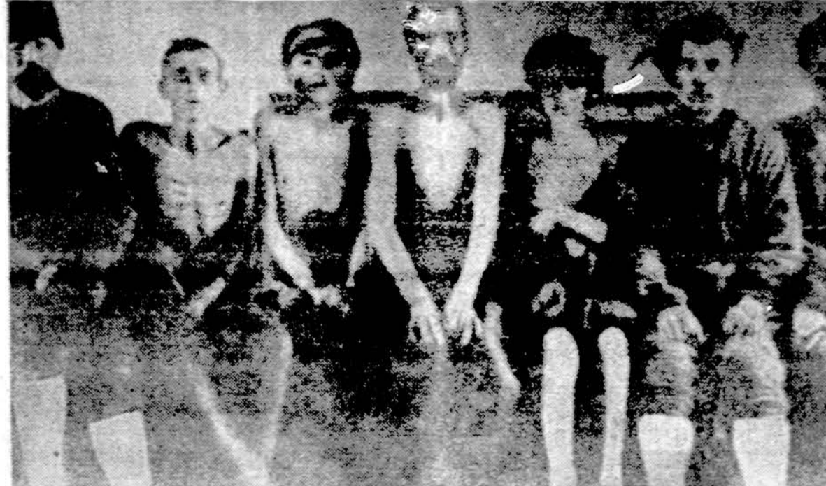
Badauja iki mirties. Slapta nuotrauka iš vienos sovietų kon centracijos stovyčios Sibire