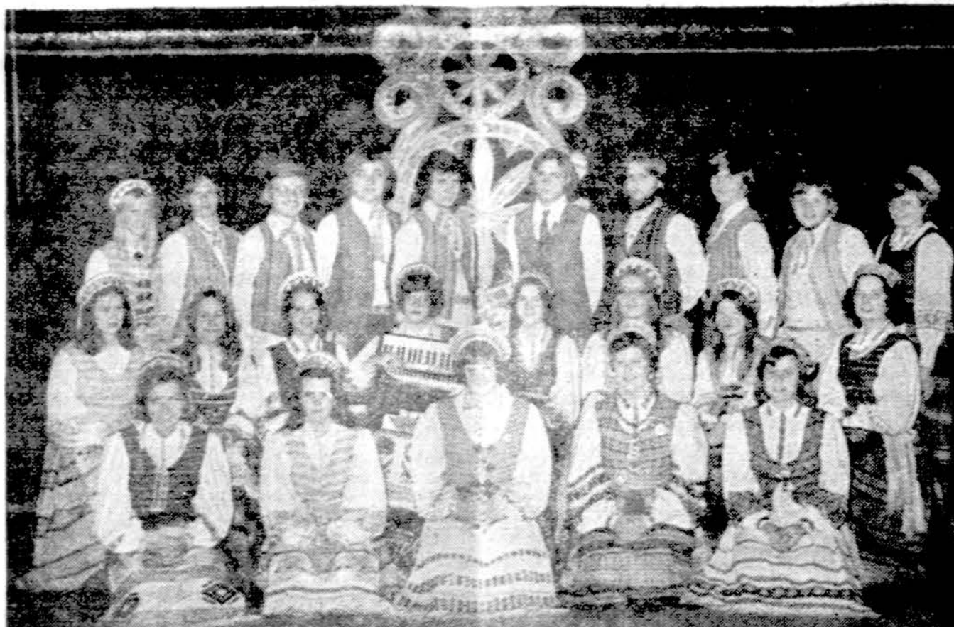
Tautinių šokių šokėjų grupė "Sūkurys" Chicagoje.

O'Hare aerodrome kai kurioms statyboms buvo panaudo-