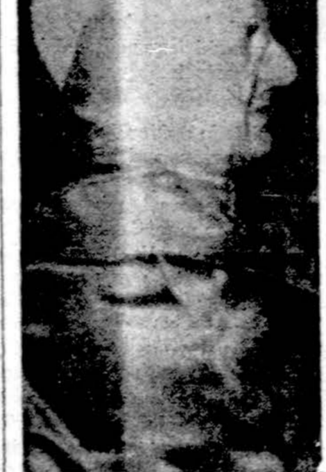
SV. TĖVAS PAULIUS VI

Lygiai prasmingas yra popiežiaus pabrėžimas lietuvių pamaldumo į Švč. Dievo Motiną Mariją, ypač Aušros Vartuose (lojoniškame tekste šalia "Porta Aurorae" yra lietuviškas pavadinimas — "Aušros Vartai") ir Šiluvoje, kuriai neseniai popiežius Paulius VI suteikė mažosios bazilikos titulą. Aušros Vartai yra Lietuvos sostinėje ir šios šventovės priminimas Lietuvos katalikams yra tarsi netiesioginis atsakymas tiems, kuriems Vilnius vis dar yra Lenkijos miestas, o "Ostra Brama" — lenkiška šventovė.