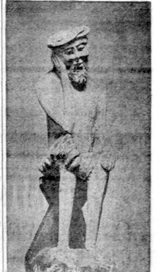
Lietuviškasis Rūpintojėlis. Zemaičių Naumiestis, Tauragės aps. (Prieškarinė nuotrauka)

KALENDORIUS Birželio 14: Bazilijus, Digna, Butrimas, Alka. Birželio 15: Vitas, Leonidė, Jolanta, Tanvilas, Barinta. Saulė teka 5:15, leidžias 8:26. ORAS Daugiausia saulėta, karšta, galimas lietus su perkūnija, apie 90 laipsnių.