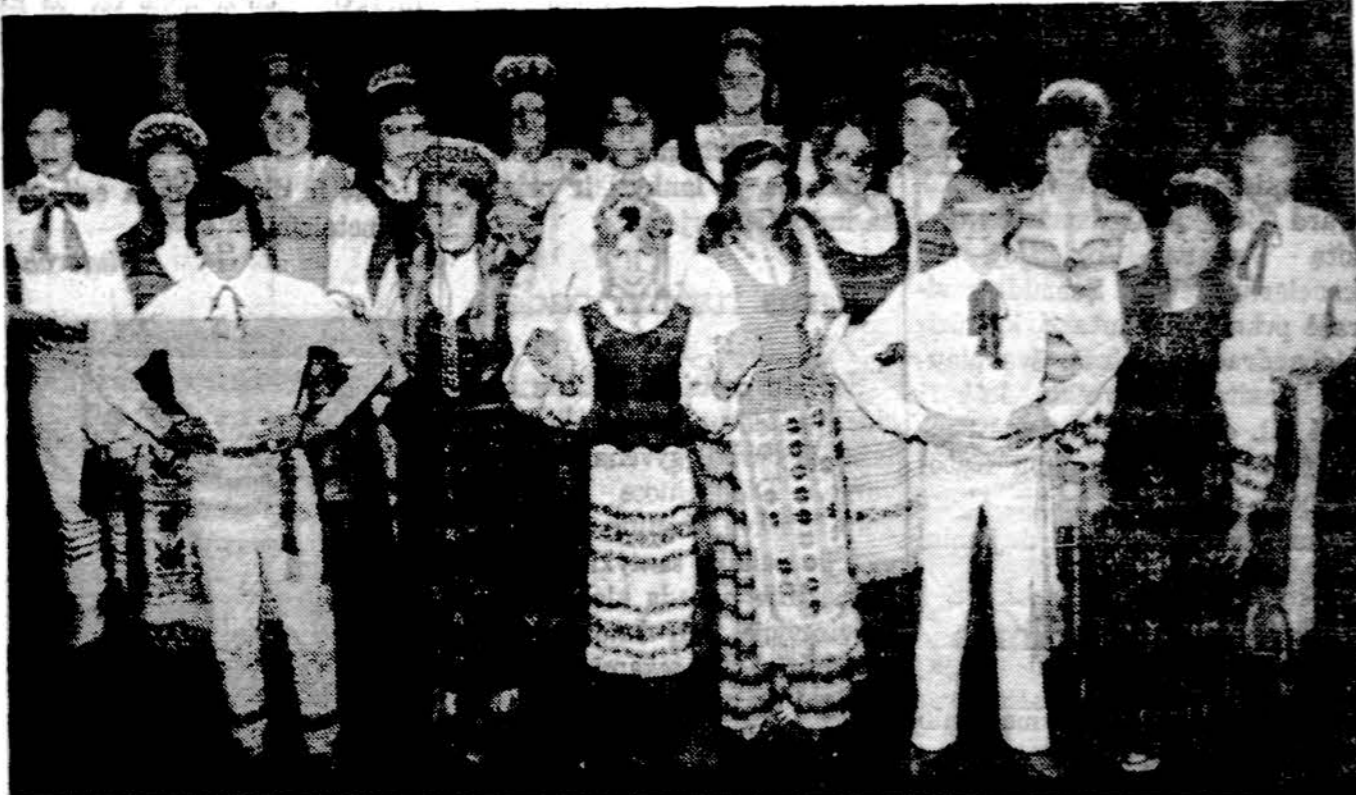
Cicero aukšt. lituanistinės mokyklos tautinių šokių šokėjai.