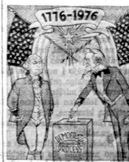
Laisvė ir demokratija yra pats brangiausias JAV turtas. Birželio 14 d. yra JAV vėliavos šventė.

Naujam profesionalui artimieji, draugai ir Hartfordo lietuvių linki sėkmės tolimesnėse studijose ir jas užbaigus vėl sugrįžti į Hartfordą. Dalyvis