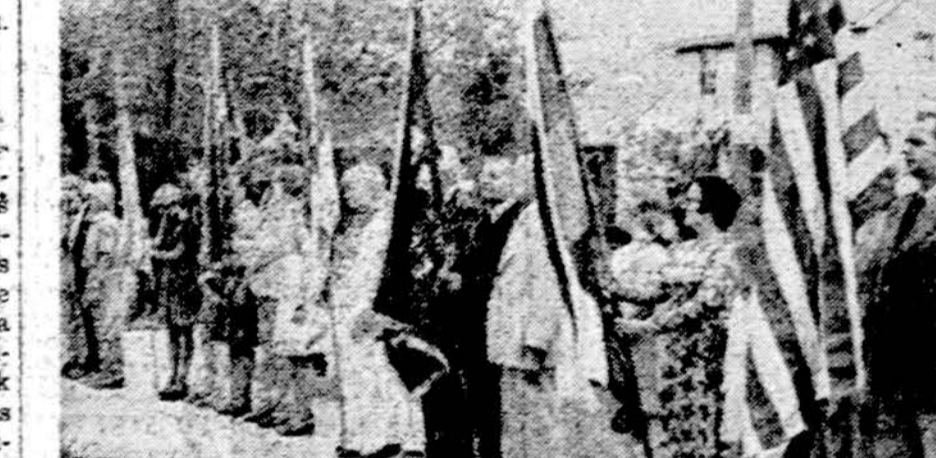
Clevelando birželio įvykių minėjime organizacijos iškilnėse prie paminklo.