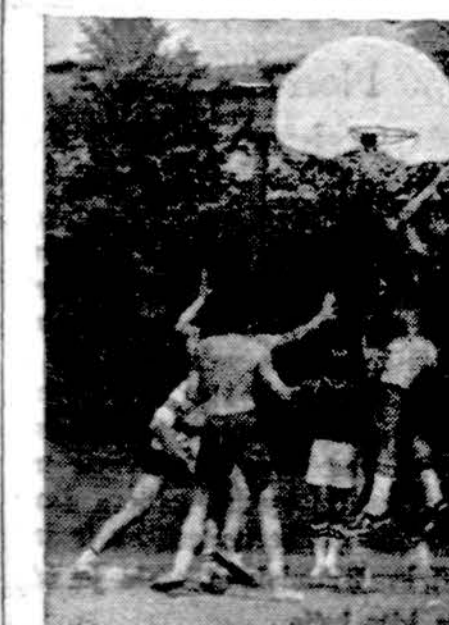
Krepšinis Dainavoje.