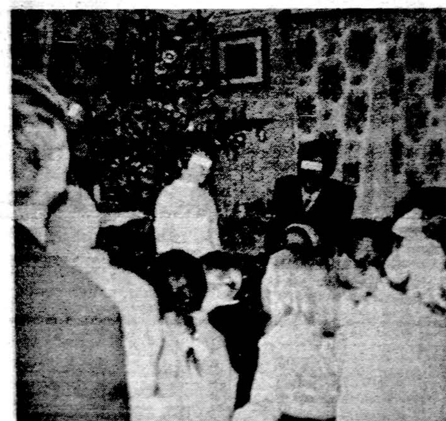
Slaapta katekizmo pamoka prie Kalėdų eglutės kažkur sovietų okupuotoj teritorijoj, gal būt, ir Lietuvoj (iš "Voice of the Martyrs" 6/1976)

Seattle. — Vandalai sulaužė ar Erovė apie 100 žydinčių japoniškų vyšnių prie Seattle Washingtono ežero. Medžiai buvo Japonijos dovana Amerikai 200 metų nepriklausomybės proga.