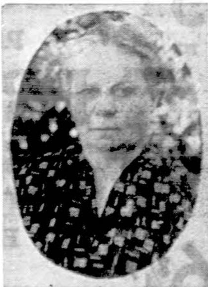
A. + A. P. Staškevičienė Mirė Biržuose 1971 m.

Pranešu draugams ir pažįstamiems, kad liepos 4 d. 1976 m. už mano mirusių tėvelių ir sesutės sielas bus laikomos šv. Mišios. Prašau juos atsiminti savo maldose.