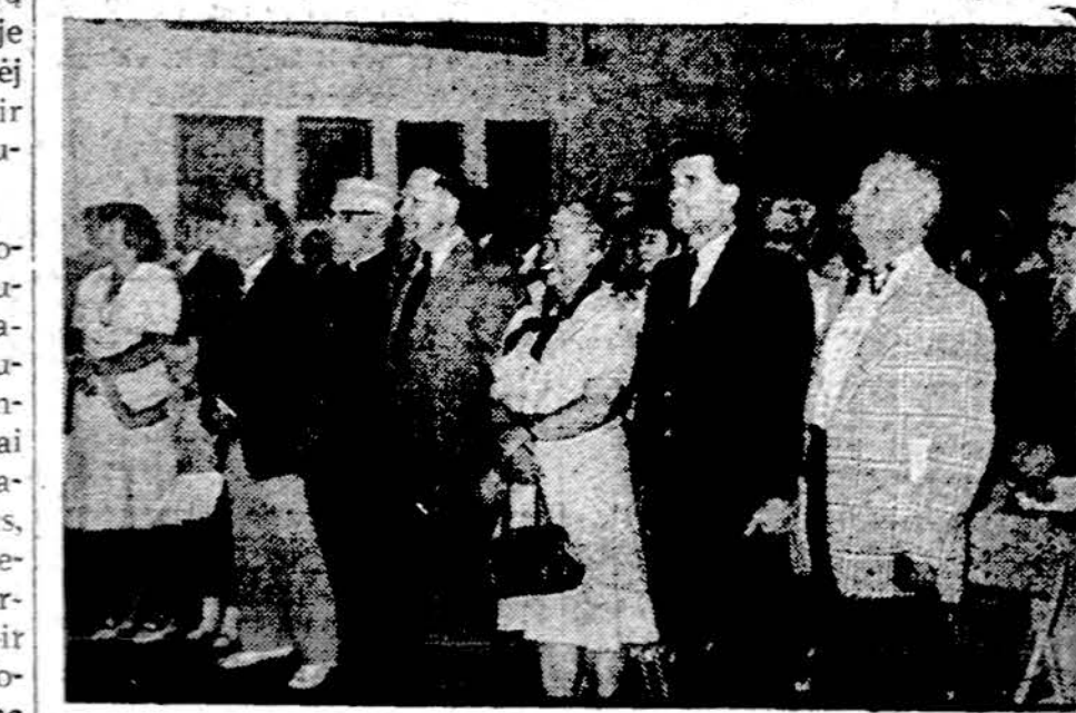
Birželio įvykių minėjime Jaunimo centre birželio 20 d.

Nepasakysiu, kad Washingtonas buvo nuoseklus vadinamame šaltame kare, kuris prasidėjo tuojuo po Potsdame pasitarimų, bet jo užsienio politikos vadovai pasimetė ypač nuo 1969 metų, kai pradėtas regėti taikos sambūvis. Tuo metu buvo vėsta uždara, dažnokai slapta ir net apgaulinga užsienio politika, siekusi jėgos pusiausvyros ir savo įtakos sričių išlaikymo. Tai buvo užsienio politika be ryškių pradų, patrauklių idėjų.