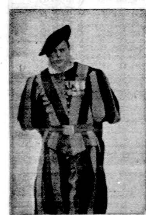
Šveicarų gvardijos sargybinis

Vatikanas. — Jau daugiau kaip keturis šimtmečius Popiežiškioji Šveicarų gvardija ištikimai atlieka labai reikšmingą patarnavimą Apaštaly Sostui, popiežiaus asmeniui ir Vatikano valstybei. — kalbėjo Paulius VI