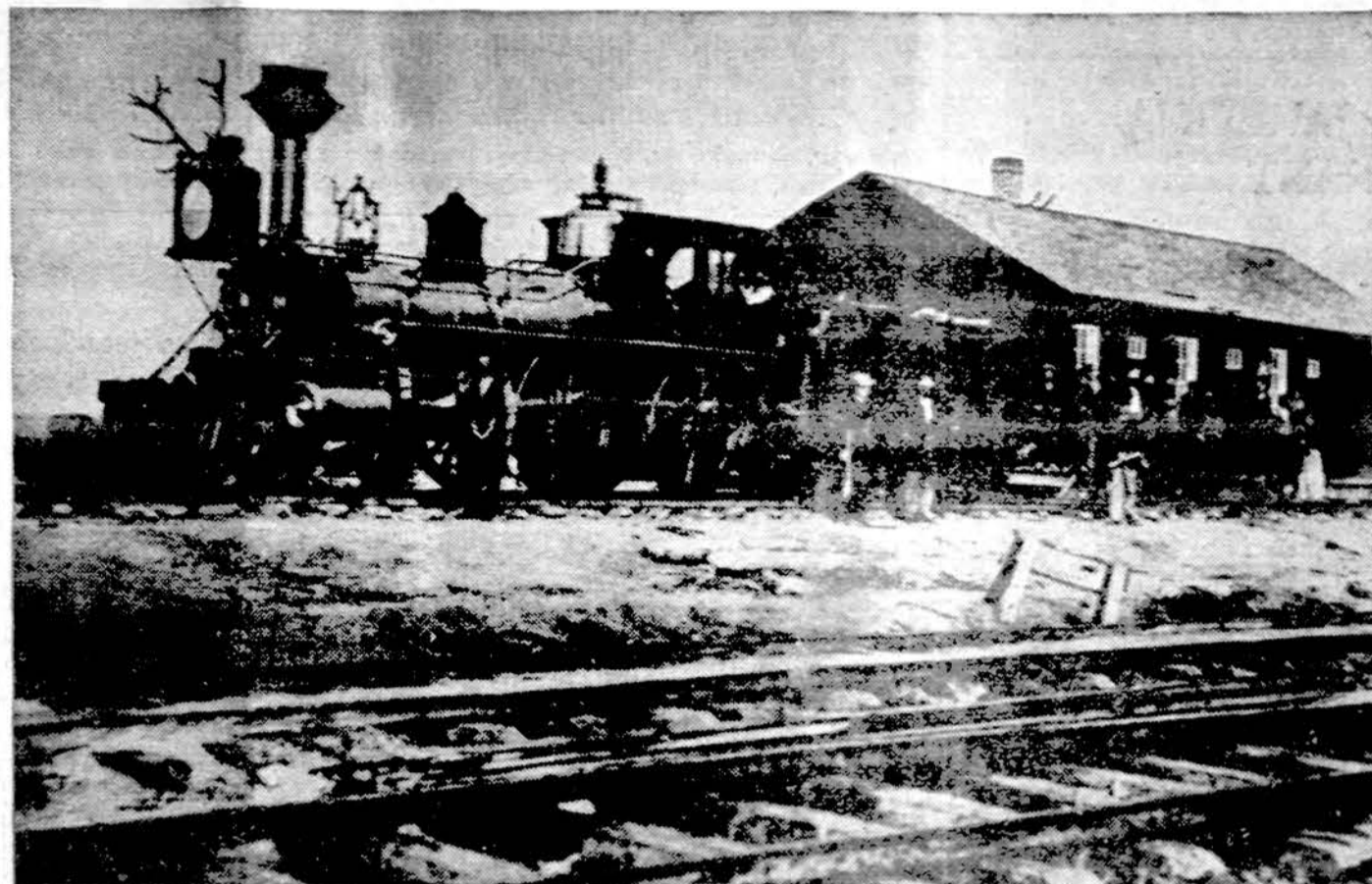
Iš Amerikos istorijos

Toliau sakoma, kad panašių priemonių turi imtis ir imasi ir Amerikos kontražvalgyba. Pati sėkmingiausia priemonė — įstatyti savo agentus į sovietų valdžios aparatą. Minimas atvejis, kai juo buvo sovietų karo aviacijos attache Washingtone.