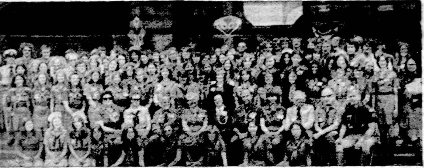
V-sis vyr. skaučių, sk. vyčių, jūros būdžių ir gintarių saskrydis įvyko B. S. A. Beaumont stovykloje Rock Creek, Ohio. Suvažiavime dalyvavo 125 dalyviai iš JAV įvairių vietovių ir Kanados.