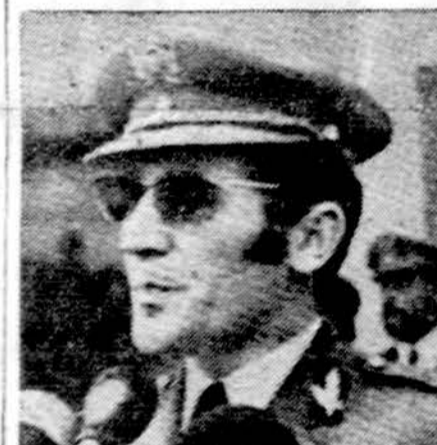
Gen. Antonio Ramalho Eanes, Portugalijos prezidentas

Taipei. — Taiwanas pasirašė kontraktą su amerikietiška Hughes Aircraft kompanija ir užpirkto už 34 ml. dolerių priešlėktuvinę sistemą. Neabejojama, kad tai buvo padaryta su Pentagono pritarimu.