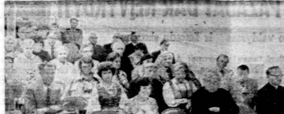
Dalis publikos, susirinkusios į birželio tragiškųjų įvykių minėjimą Bostone. Platanis įvykio aprašymas buvo praėjusios savaitės Bostono žiniuose.