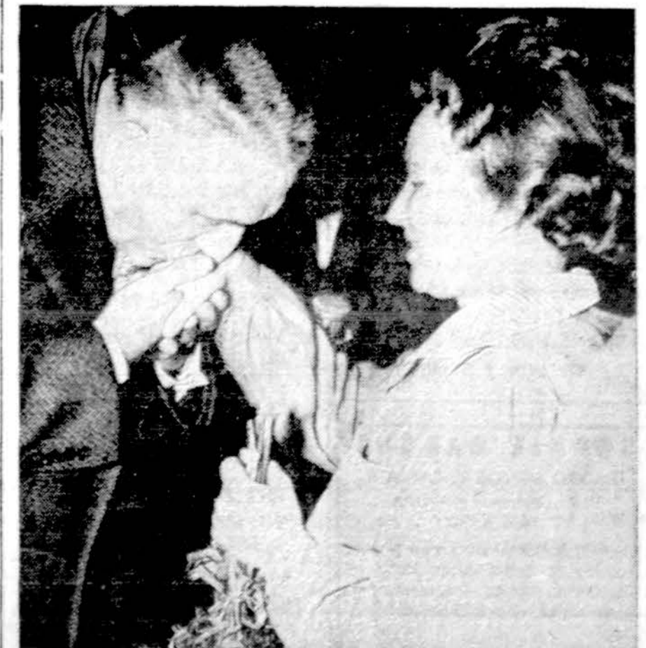
"Buržuaziniai papročiai", arba lenkų komunistų partijos vadas Edward Gierk jaunai poniai, darbininko žmonai, bučiuoja ranką

San Juan, Puerto Rico. — Ekonominė viršūnių konferencijai pasibaigus, buvo paskelbtas komunikatas ir pažadėta susilaikyti nuo didelių išlaidų gyvenimo gerinimui, bet dėmesį skirti infliacijai sulaukyti. Dar sutarta per Tarptautinį pinigų fondą pagelbėti sunkiai besiverčiančiai Italijai.