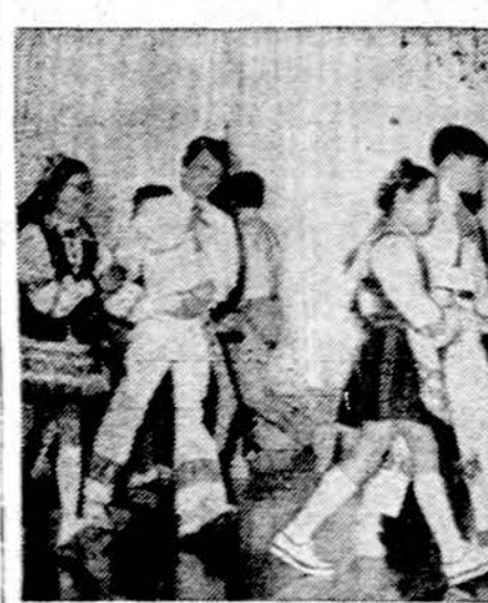
Brighton Parko, Chicagoje, jauni mokslo mokytojai.