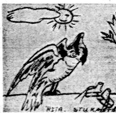
Piešė Rita Stukaitė, Marquette Parko lit. mokyklos 6 sk. mokinė