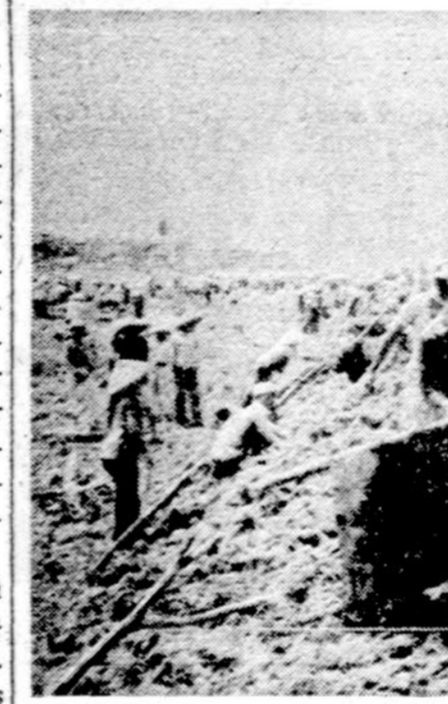
Užtvankų statymo darbai Vietname. Sunkiausias darbus primityviausiai įrankiais turi dirbti karą pralaimėję buv. Pietų Vietnamo karininkai

Tos sėkmės skatinami, Iranas su Iraku ketina reikalauti visas svetimas valstybes pasitraukti iš Persijos įlankos. Jeigu tai įvyks, JAV turės aplėsti savo nedidelę bazę Bahreino saloje, bet taip pat turės iš ten pasitraukti ir S. Sąjunga, kur ji jau nuo seniai turi įsirengusi stiprią karinę bazę. Tuo būdu įlanka paliktų konservatyvių, provokarie-