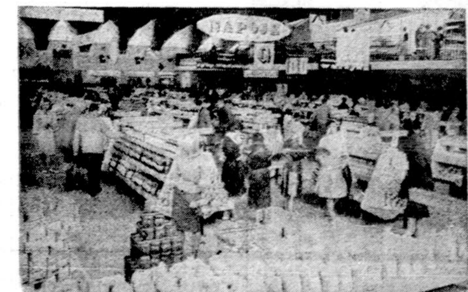
Nėra kolchozų, nėra sovietinės administracijos — yra daugiau duonos ir prekių. Viena iš didžiųjų krautuvių — apsipirkimo centras Varsūvoje, Lenkijoje