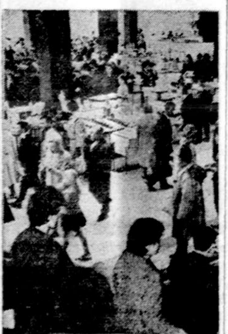
Maskvos apsipirkimo krautuvėje. Daugiau pirkėjų nei prekių

Washingtonas. — Telefoniniai pasikalbėjimai iš automatiškai nuomatomi vėl pabranginti. Greitu laiku gali prireikti 25 centų.