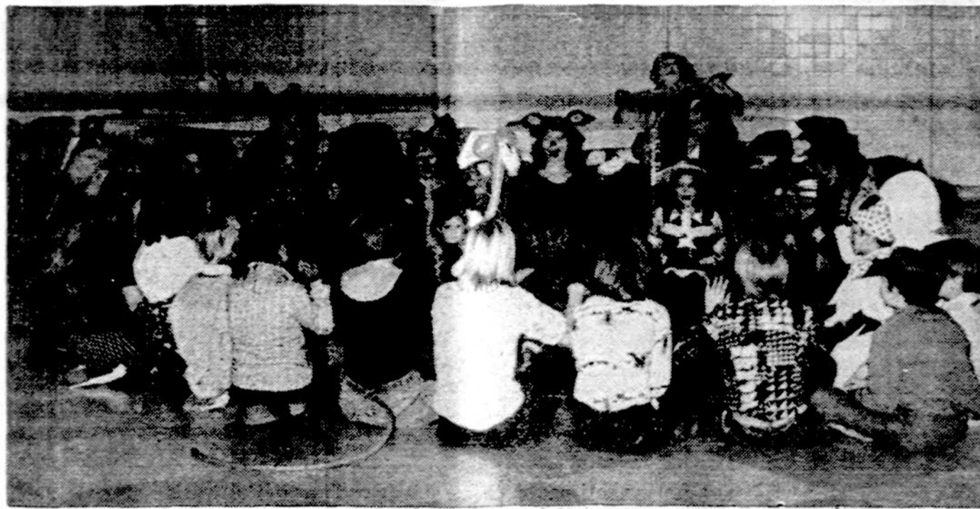
Linksmi ir įdomūs žaidimai Prano D'elininkaičio kuopos parengime, Chicagoje. Nuotr. P. Kubiliaus