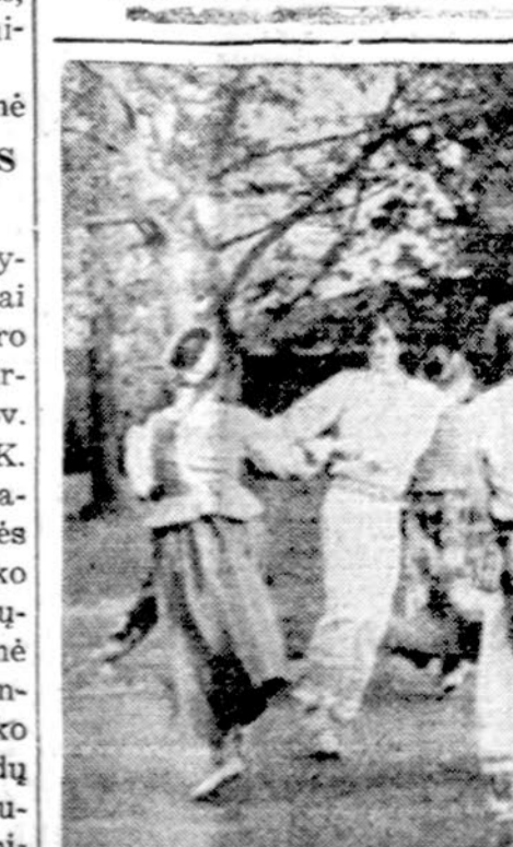
Detroito tautinių šokių grupės šilainės jaunesnieji šokėjai.