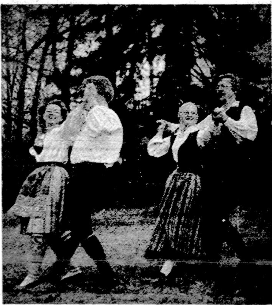
Estai šoka tautinius šokius.