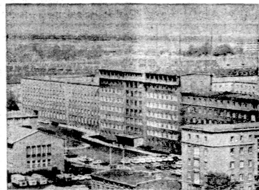
Komunistinės Rytų Vokietijos saugumo ministerijos rūmai — vienas didžiausių pasaulyje šnipinėjimo centrų

stiprybės iš europiečių atsikratyti Anglijos priespaudos. Anksčiau Amerikos kolonijos skundėsi karaliui, kaltino jo ministrus ir Anglijos parlamentą, išleidusius nepakenčiamus įstatymus, nors angliai nemurmėdama juos vykdė. T. Jeffersonas pakeitė puolimo būdą, nes jis Jungtinių Valstybių nepriklausomybės paskelbimo rašte jau kaltinamas karalius, vyriausias suverenas. O tokių kaltinimų randame net 27. Kai kurie kaltinimai buvo kiek perdėti ir panaudoti propagandiniai teigimai kongresui palenkti, kad visos kolonijos sutartinai pareiktų nutraukiančios ryšius su Anglija.