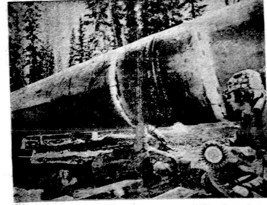
Alaskos naftotiekio tiesimo darbai. Vamzdžių suvirinimas ypatingai sunkus darbas