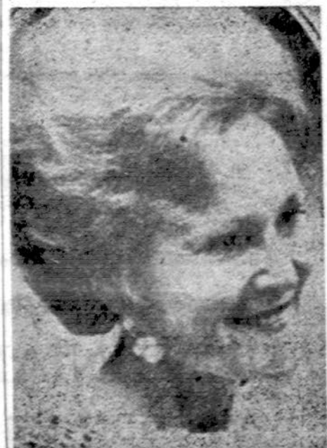
Mrs. Pat Nixon

Long Beach, Cal. — Mrs. Pat Nixon, 64 metų, yra kritiškai padėty. Gavo stroką ir į ligoninę buvo ne tuoj nuvežta, nes ir pati nežinojo, kas su ja atsitiko. Ji, panašiai kaip esti ir su daugeliu kitų, manė, kad tik poilsio reikalinga, pasijutusi blogai namie pasiliko 21 valanda. Į ligoninę buvo nuvežta, kai jau negalėjo pastovėti. Jos kairysis šonas yra dalinai paralyzuotas, sunkiai gali kalbėti.