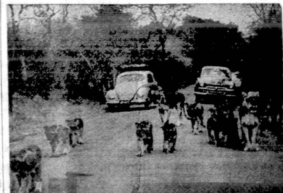
Atsargiai, pėstiesiems pirmenybė. Pietų Afrikos drausinis

Londonas. — Britų diplomatas buvo pasiūstas į Uganda suieškoti, kur yra 74 metų Dora Bloch, įkaitas, palikta po Izraelio išvadavimo kitų įkaitų. Entebbe aerodrome ji buvo susirgusi ir nuvežta ligoninėn, Britų ambasados atstovas ją ligoninėj aplankė 12 valandų po įkaitų išvadavimo, bet po valandos grįžęs su maistu nebuvo įleistas. Manoma, kad ji buvo nužudyta. Yra kas girdėjo ją rėkiant, kai ji buvo ištempta iš ligoninės. Ji turėjo dvigubą Izraelio - Britanijos pilietybę.