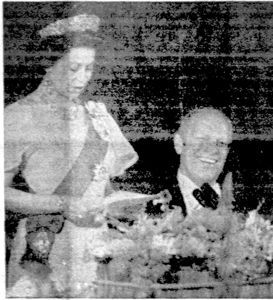
Karalienė Eilbieta sveikina Ameriką iškilminguose pietuose, Washingtone