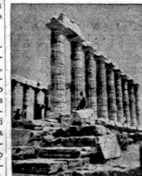
Atėnai, praicitis liudininkai

Canberra. — Sausra kamuoją ir Australiją. Ūkininkai beveik priversti be laiko paskersti dešimtis tūkstančių galvijų, o kviečių derlius bus 20% mažesnis. Tai labai atslieps į eksportą.