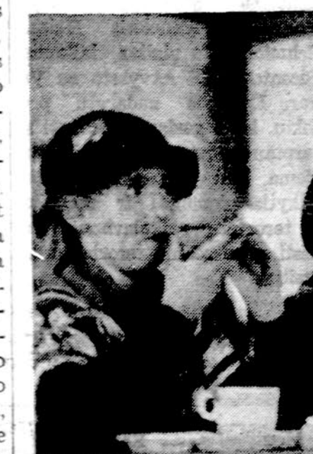
Pirmasis užkandis stovykloje.