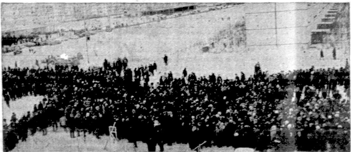
Jie nori pirkti automobilį. Keturis kartus per metus kur nors Maskvos pakraštį būna priimami pareiškimai automobiliui pirkti, ir tada subėga žmonių minios. Kiek dar reikia laukti sumokėjus pinigus, tai kitas klausimas.