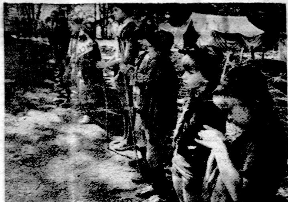
Kernavės tunto paukštytės pasiruošusios pirmajai rytminei inspekcijai stovykloje.

Skautų programoje jau šešti metai iš eilės New Yorkas laimėjo vadeivos pereinamąją taure. New Yorko Tuntro tunto broliai surinko 45 taškus. Bostonas 35, New Jersey 33, Worcesteris 28 ir Hartfordas 25. New-yorkiečių dominavimą nulėmė krepšinis ir stalo tenisas, o lengvosios atletikos laimėjimais pasidalino Bostonas, New Jersey ir Worcesteris. Jaunių grupė: krep-