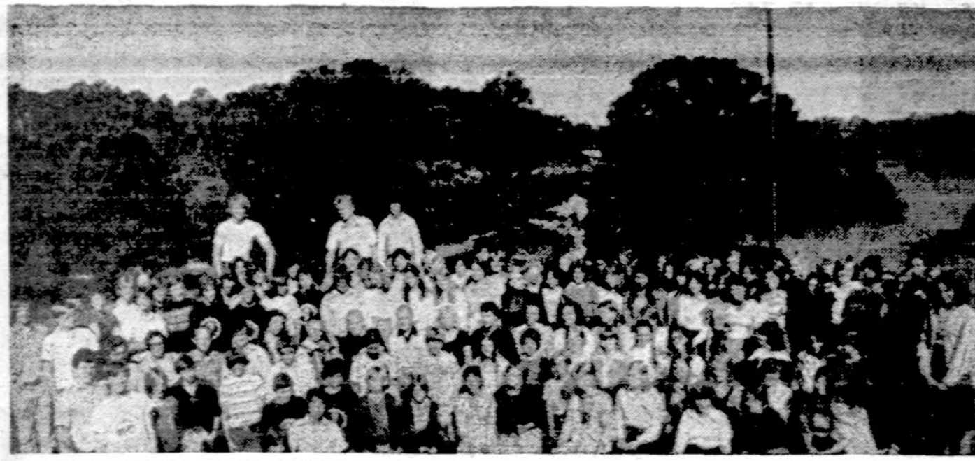
Moksleiviai ateitininkai, stovyklavę Dainavoje.