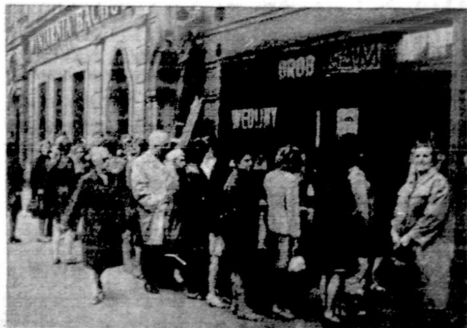
Eilutė prie mėsos krautuvs Varšuvoj. Lenkai, bijodami kainų pakilimo, sudarinėja maisto atsargas

Žodinis karas tarp Ugandos ir Kenijos tęsiasi. Viršūnė pasiekė praėjusį šeštadienį, kai Ugandos radijas pranešė, jog Kenijos prezidento Jomo Kenyatta rezidencija Nakuru vietoje, kur jis daugiausia ir praleidžia laiko, ir jų uostas Mombasa bombonesiams labai lengvai pasiekiamas.