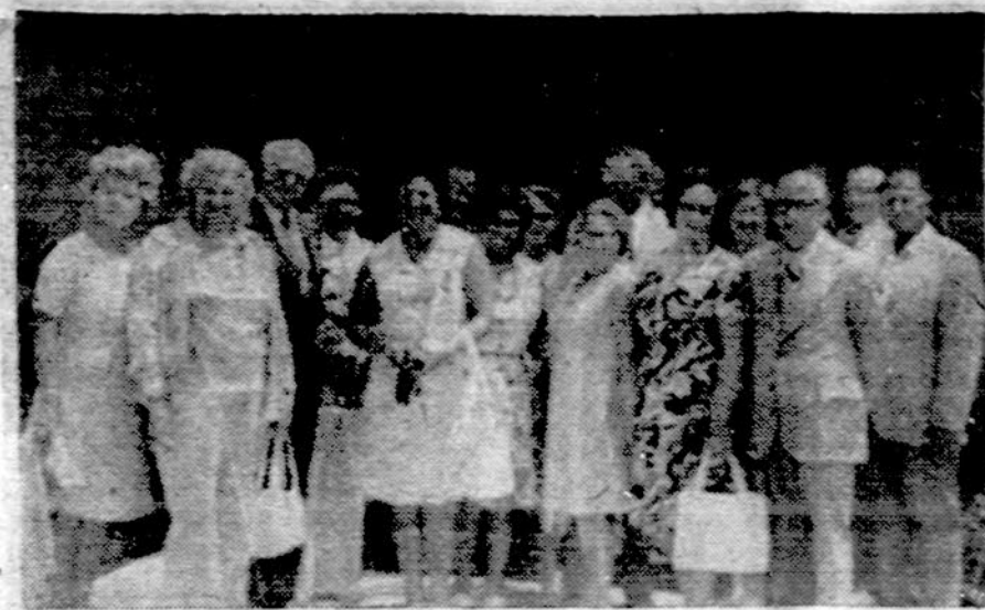
Palm Beach Lietuvių klubo nariai prie Juno Beach St. Paul of the Cross bažnyčios po pamaldų kun. A. Bielskio mirties metinių progą. Lietuviškos pamaldos šioje bažnyčioje vyksta kiekvieno mėnesio pirmąjį sekmadienį 2:00 val.

Kalbama papildomam knygos skirsnėliui suformuluoti man reikalinga turėti pavadinimus vietovių (pagal apskritis), kur buvo vietos gyventojų sukiliminių veiksmų įvykę, kada ir kuo