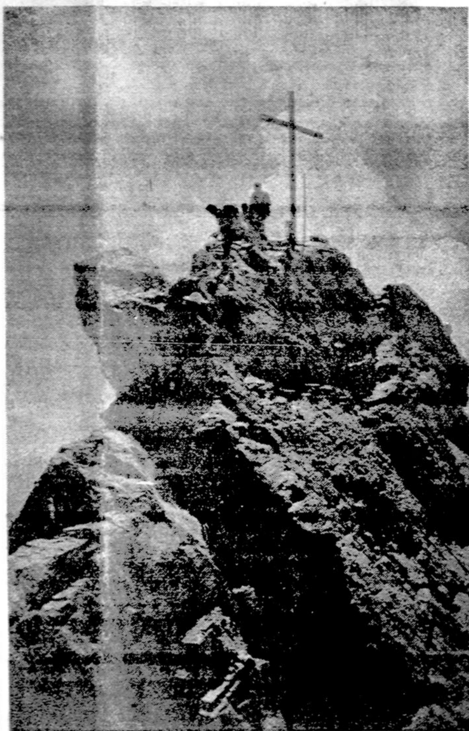
Tirolio Alpėse, Austrijoje