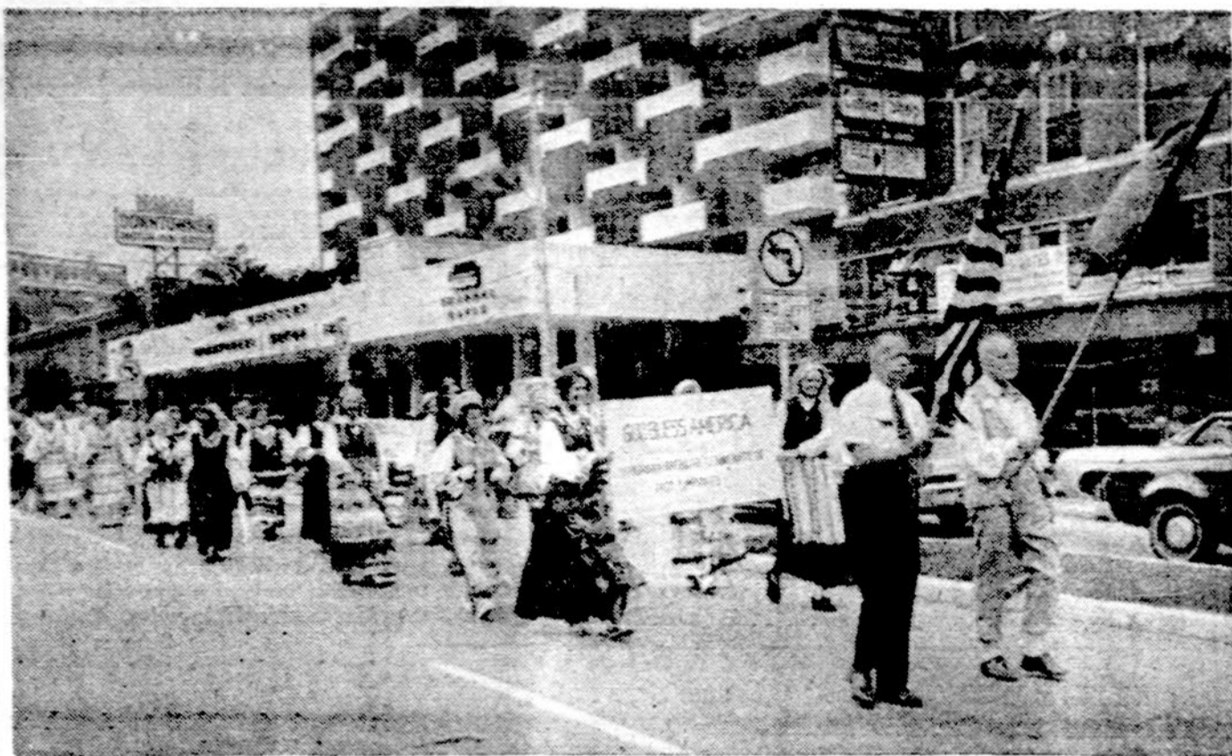
Lietuviai Hot Springs, Ark. JAV nepriklausomybės minėjimo parade.