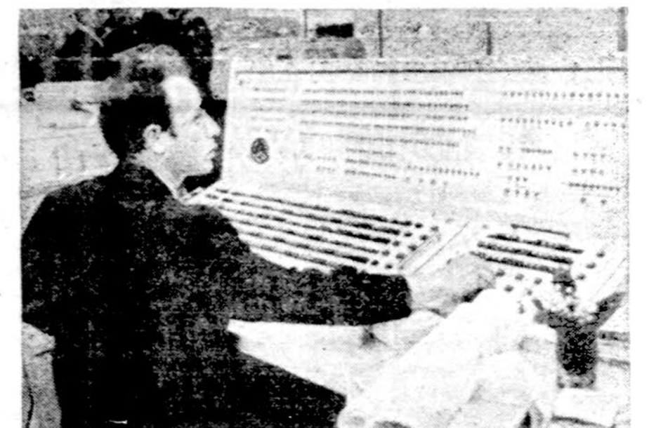
Sovietinis kompiuteris ir jo operatorius. Dešimtį metų rusai atsiliek nuo Amerikos

Kamčatkos aukso ir platinos kasyklos yra didelės Sovietų pajamų šaltinis. Ten dirba pasmerkti mirti kaliniai. Aukša ir platiną pardavinėja Šveicarijos, Prancūzijos ir Anglijos rinkose. Kasdien kreant aukso kainai, sumažėjo Sovietų aukso pajamos.