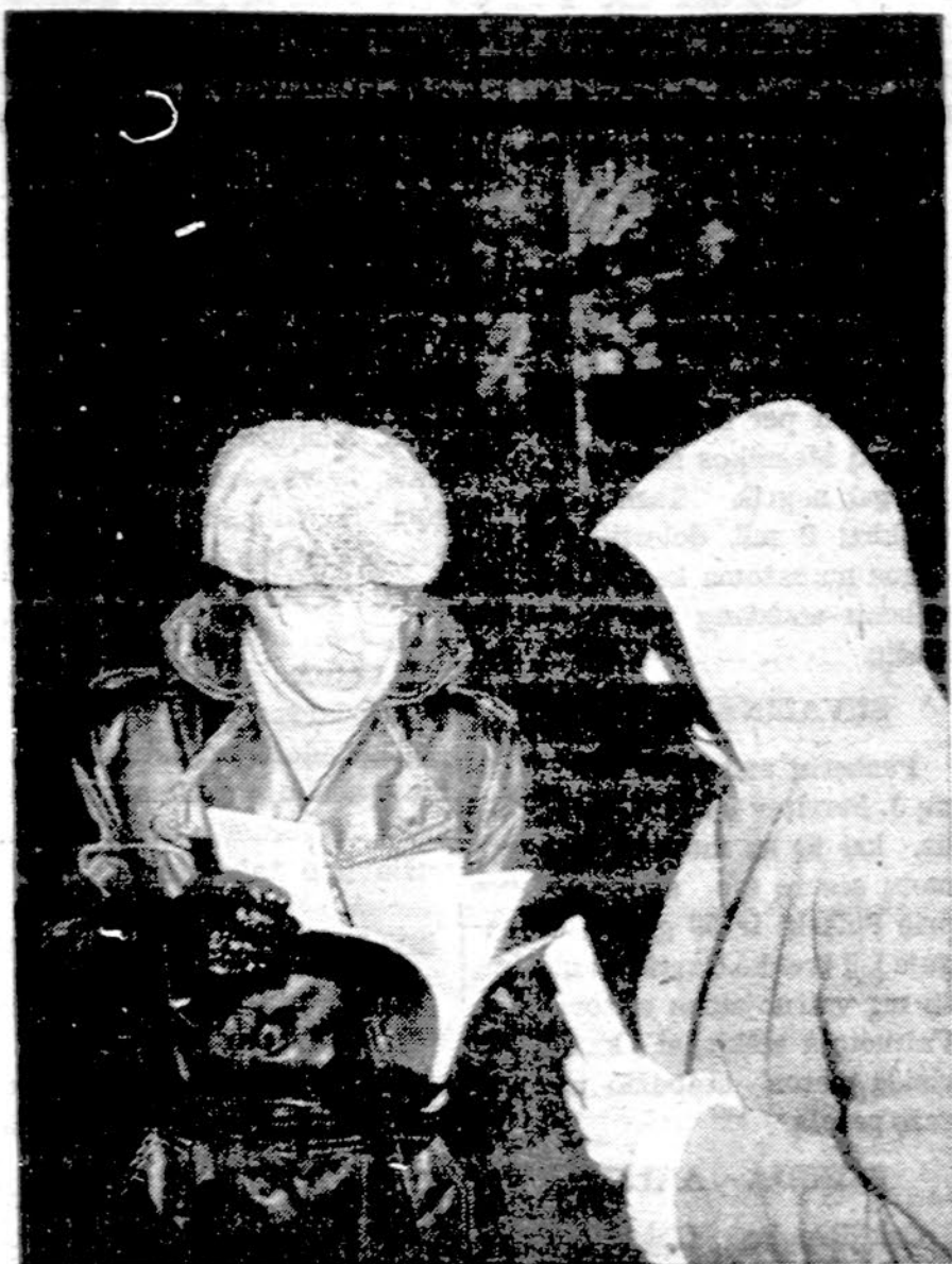
Studentai budi prie lietuviško kryžiaus, prie Sv. Vardo katedros Chicagoje budėjimo metu.