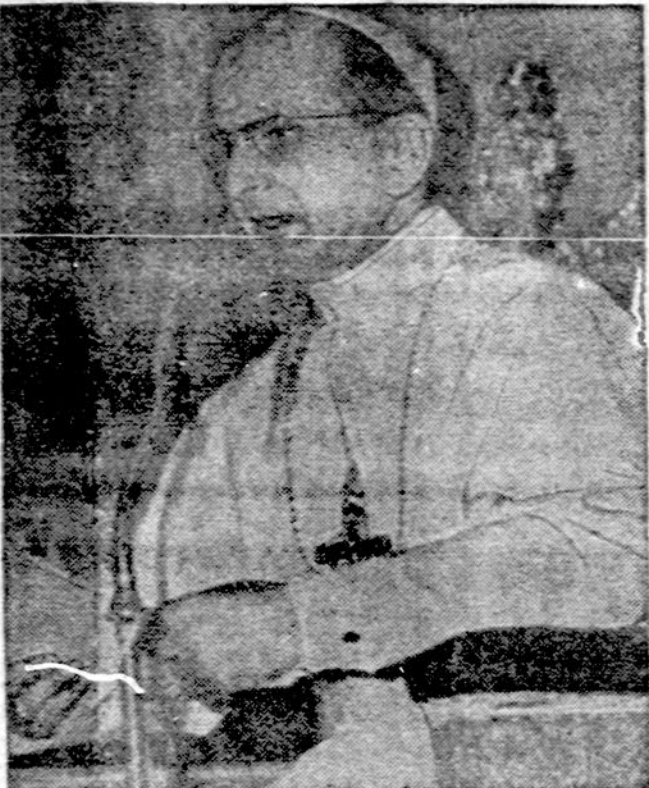
Popežius Paulius VI, kuris kalbės Eucharistiniam kongresui