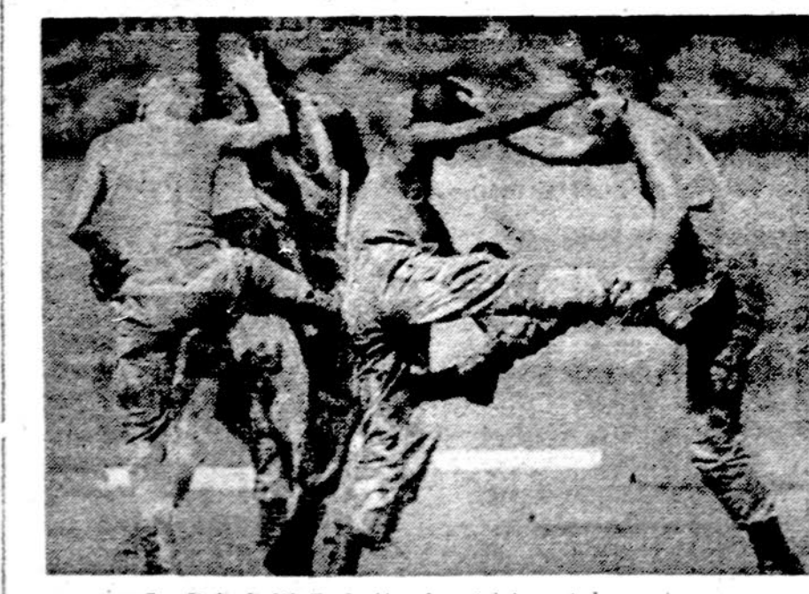
Juodi ir balti Rodezijos kareiviai pratybų metu

— Aukščiausias geležinkelis nu-tiesias Peru. Jis eina Andų kal-nais 4008 metrų aukštyje. Kelei-viams išduodami deguonies prietai-sai.