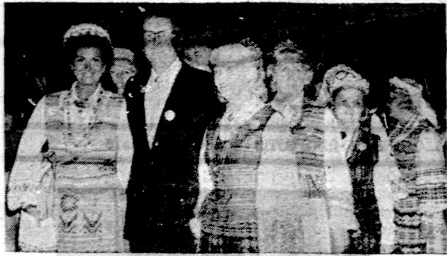
Vaidzas iš Los Angeles mieste įvykusios šokių šventės.

Atsakymas. Taip. Pagrindinis atlyginimas medicininėi apdraudodai pakils nuo 6.70 iki 7.20 dol.