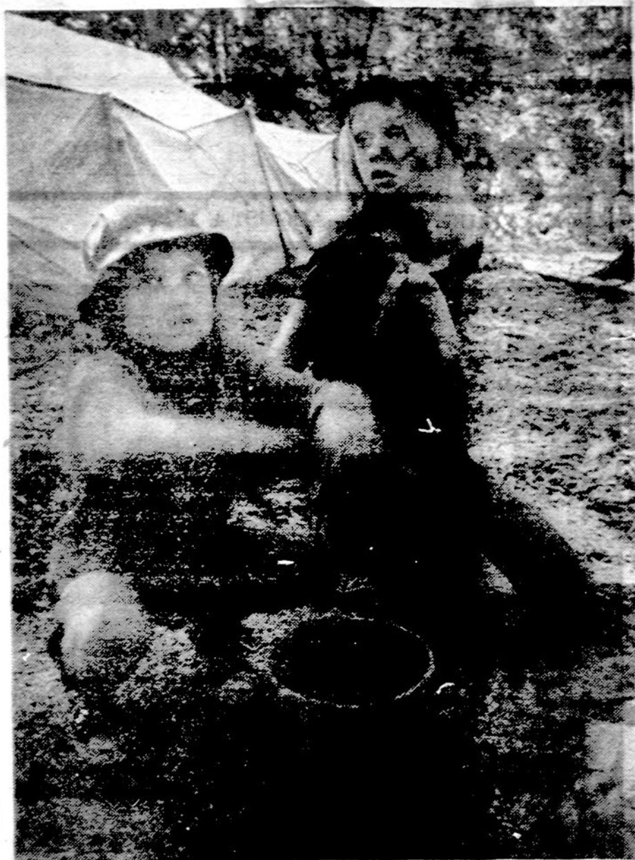
"...tas puodas, tas puodas, kaip žiūri vis juodas..."