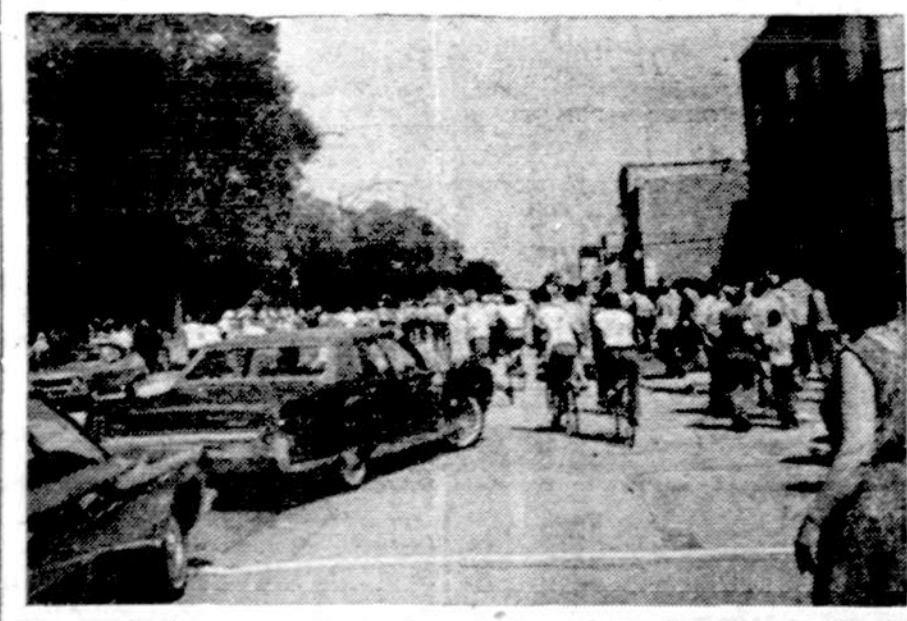
Chicagos juodųjų suorganizuota eiseną į Marquette Parką.