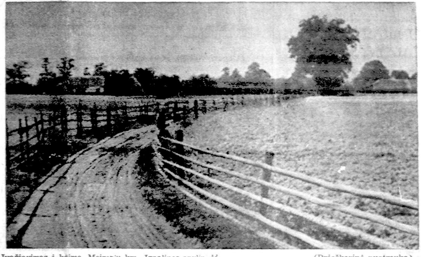
Įvažiavimas į kaimą. Meironių km., Ignalinos apylin. ėj. (Prieškarinė nuotrauka)