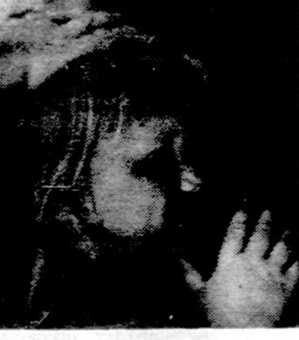
Paukščių vakartinis susimastymas stovykloje.

Iki šiol dar ne visi Brolijos vienetai yra atlikę 1975 m. registraciją bei susimokėję nario mokesčių. Registracija su nario mokesčiu turėjo būti pristatyta Brolijos išdiminkui iki 1975 m. gruodžio 31 d. Visi vienetai raginami kuo greičiausiai šią pareigą atlikti.