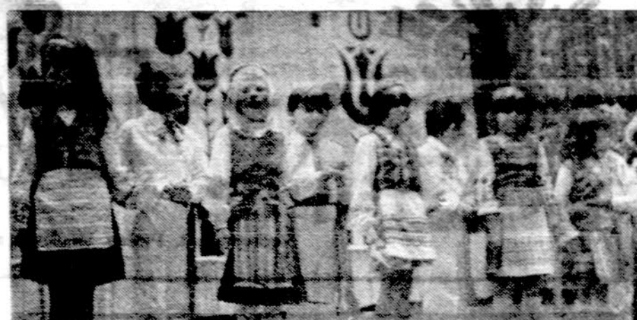
Mažieji Chicago lietuvikai atlieka programą.

Liekame dviese. Pasistatome palapinę, išitiesime miegojimo maišus. Prie durų pasistatome lempą ir gazolino bieltinę. Jei reikia šviesos ar šilumos, viska