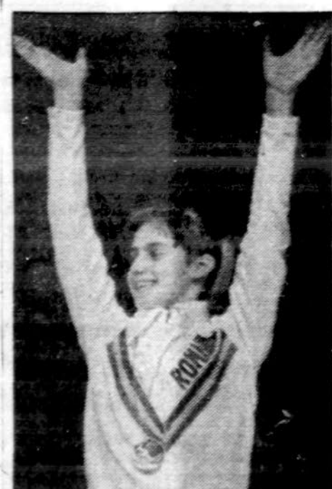
Nadia Comaneci, 14 metų, amžiaus rumunų gimnastė, Montrealio olimpiados žvaigždutė

Nairobi. — Ugandos ir Kenijos atstovai Kenijos sostinėje pradėjo pasitarimus abiejų šalių santykių išlyginimo reikalui. Kenijoje pranašaujama, kad Idi Amin dienos suskaičiuotos. Tokio žiaurais ir neprototo diktatoriaus tauta negalės ilgai pakęsti.