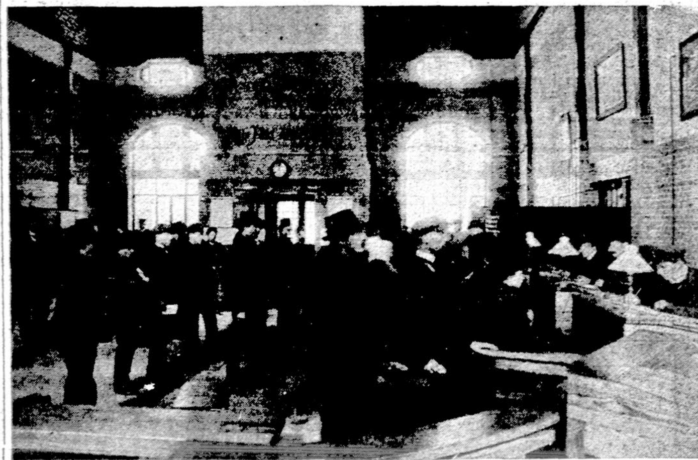
Emigracijos į Ameriką laikus prisiminus. Emigrantų eilės kurių tarpe yra ir lietuvių, atlieka kelionės formalumus Hamburge — Amerikos laivų linijos kontoroje Hamburge, 1909 metais