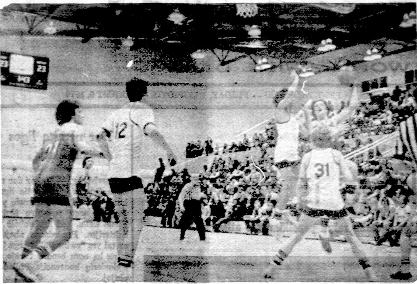
IS lietuvių krepšinio pirmenybių. A Klaseje žaidžia "Neris" prieš "Lituanica"

Finalinės rungtynės vyko šlapioje aikštėje, lietui lyfiant be sustojimo ir prie 73.000 žiūrovų. R. Vokietija sužaidžia pasigėrėtinai ir užtikrintai nugalė 1972 m. penktadienį.