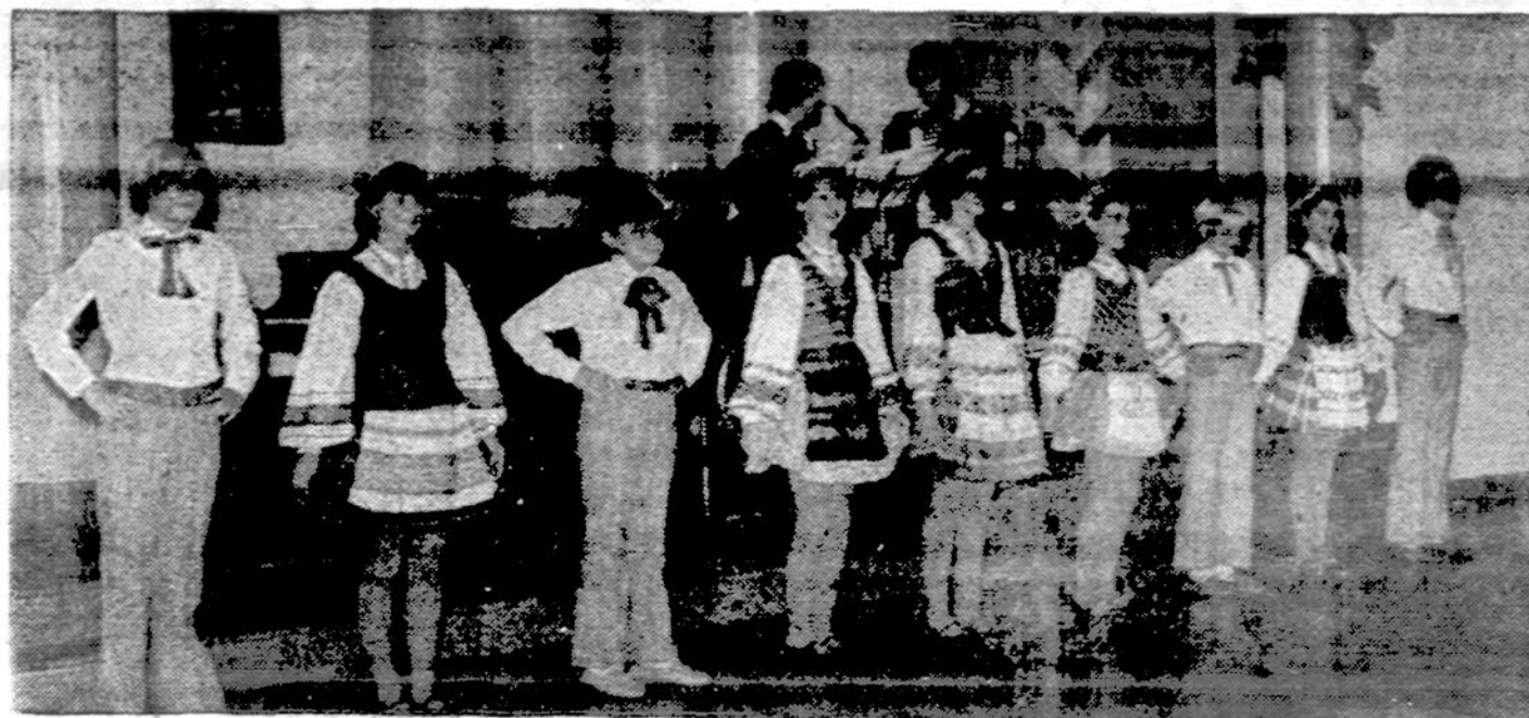
Grandinėlės jaunųjų šokėjų dalis rengiasi Liet. Tautinių šokių šventei.