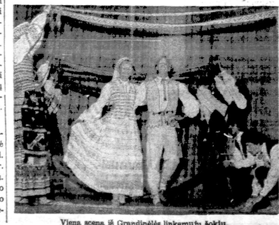
Viena scena iš Grandinėlės linksmųjų šokių.

Chicago's miesto susisiekimo vadovybė, norėdama mažinti deficitą, siaurina autobusų patarnavimą.