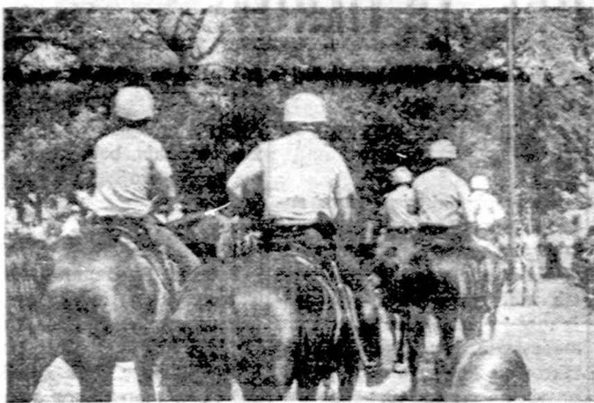
Raitoji policija Chicago Marquette Parke, į kurią juodieji buvo suorganizuavę eiseną.

Po pamaldų visi greitai išsiskirstė, nes kiekvienam rūpėjo kuo greičiau nuvažiuoti ar nueiti į namus. Mes irgi, cibulskiečiai, tuojau po pamaldų paliko-