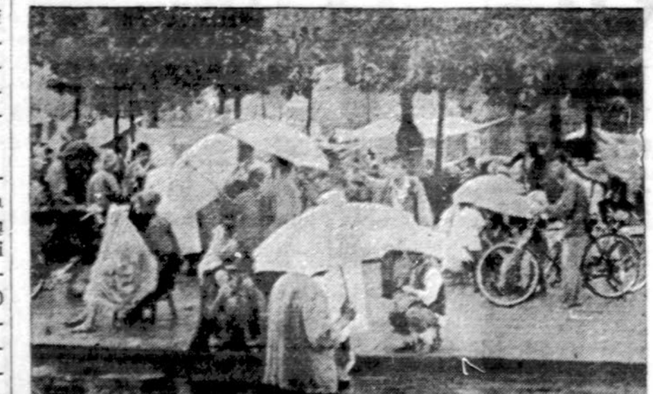
Pekino gatvėse. Žmonės, laukdami galimo naujo žemės drebėjimo, gyvena palapinėse ir po skėčiais