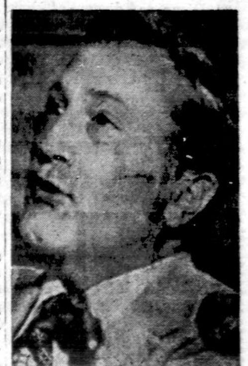
Sen. Richard Schweiker, Reagano parinktas kandidatas į viceprezidentus

Washingtonas. — Demokratų parinktas kandidatas Jimmy Carteris minėjo, kad ir jis, būdamas prezidentu, būtų tą patį padaręs su Nixonu, ką padarė Fordas — būtų atleids visas jo kaltes. Tik jis tai būtų padaręs kiek vėliau, pirmiau leistų teismui išnagrinėti bylą. Toks Fordo pasielgimas tikrai buvo naudingas Amerika. Carteris tik austeibintas, kad jo partneris, sen. Mondale, demokratų konvencijoj kitai kalbėjo. Jis mano, kad Mondale tos minties atsisakys ir pripažins, jog kraštui yra geriau nenuteisti buvusį prezidentą.