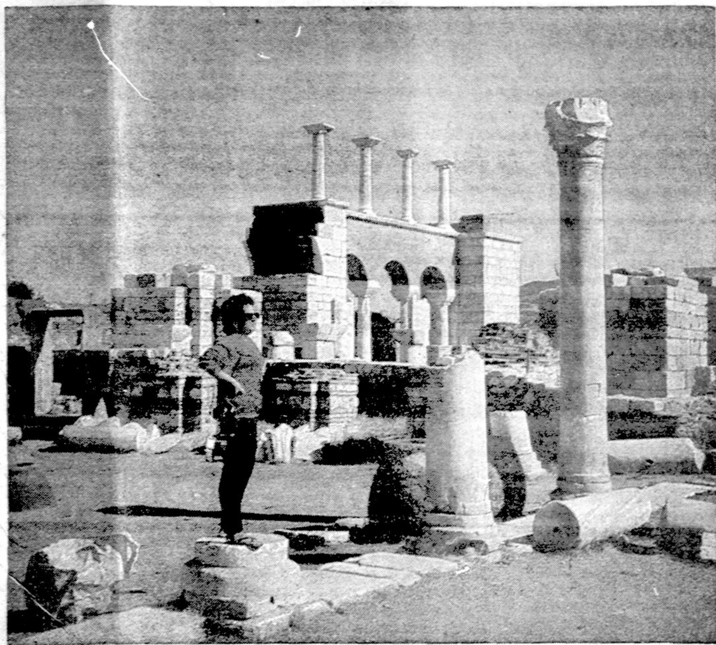
Efezas, Turkija. Šv. Jono bazilikos griuvėsiai. Efezas dažnai minimas Naujajam Testamente