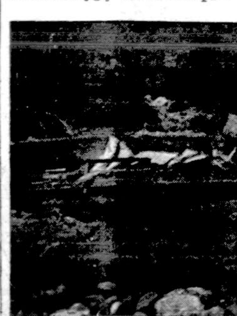
Po Big Thompson upės katastrofos. Srovės neštas ir ant tilto užmestas namas.

Lueneburg, V. Vokietija. — Aukščiausiasis teismas uždraudė Vakarų Vokietijoje platinti Hitlerio knygą "Mein Kampf".