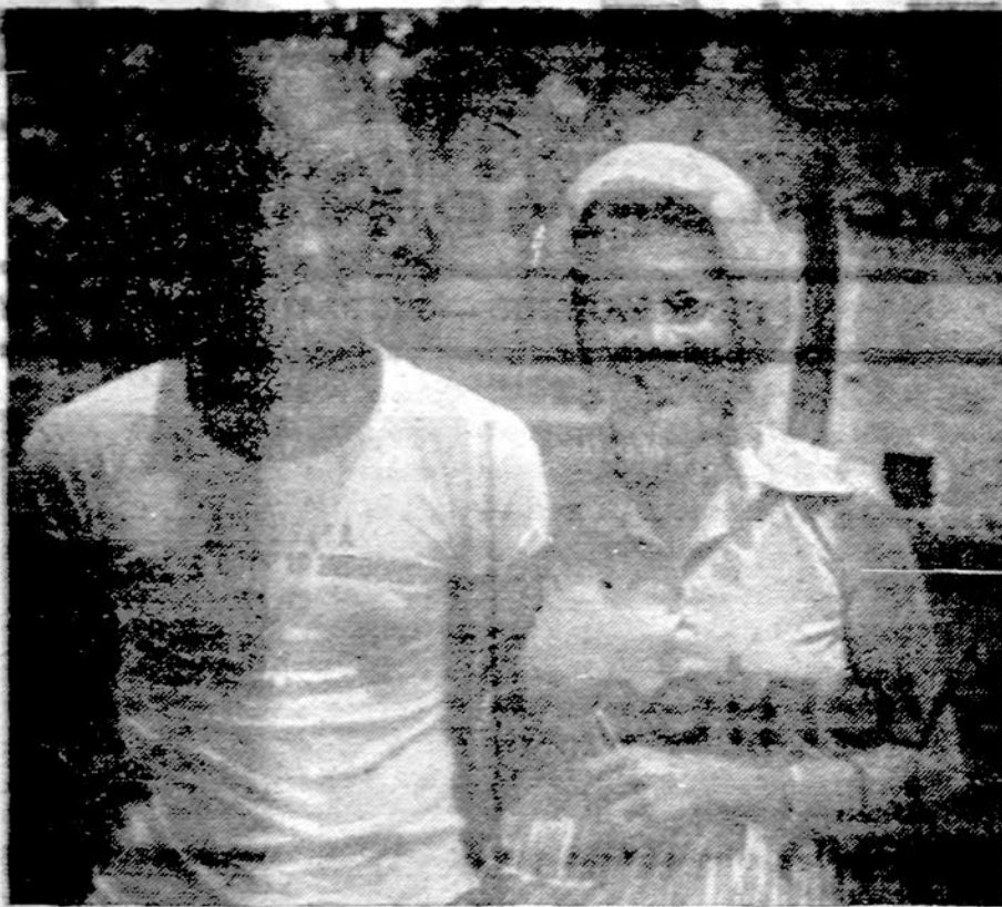
St. Solys — pabaltiečių teniso vieneto — vyrų ir mišraus dvejetainio meistras su savo mama — asmenišku šolieriu.

USA randasi S. Amerikos pirmoje grupėje, kartu su Kanada ir Meksika. Tik čia dar ne viskas: B. Amerikos, Centrinės Amerikos ir Karibijos kvalifikuosis tik vienas laimėtojas.