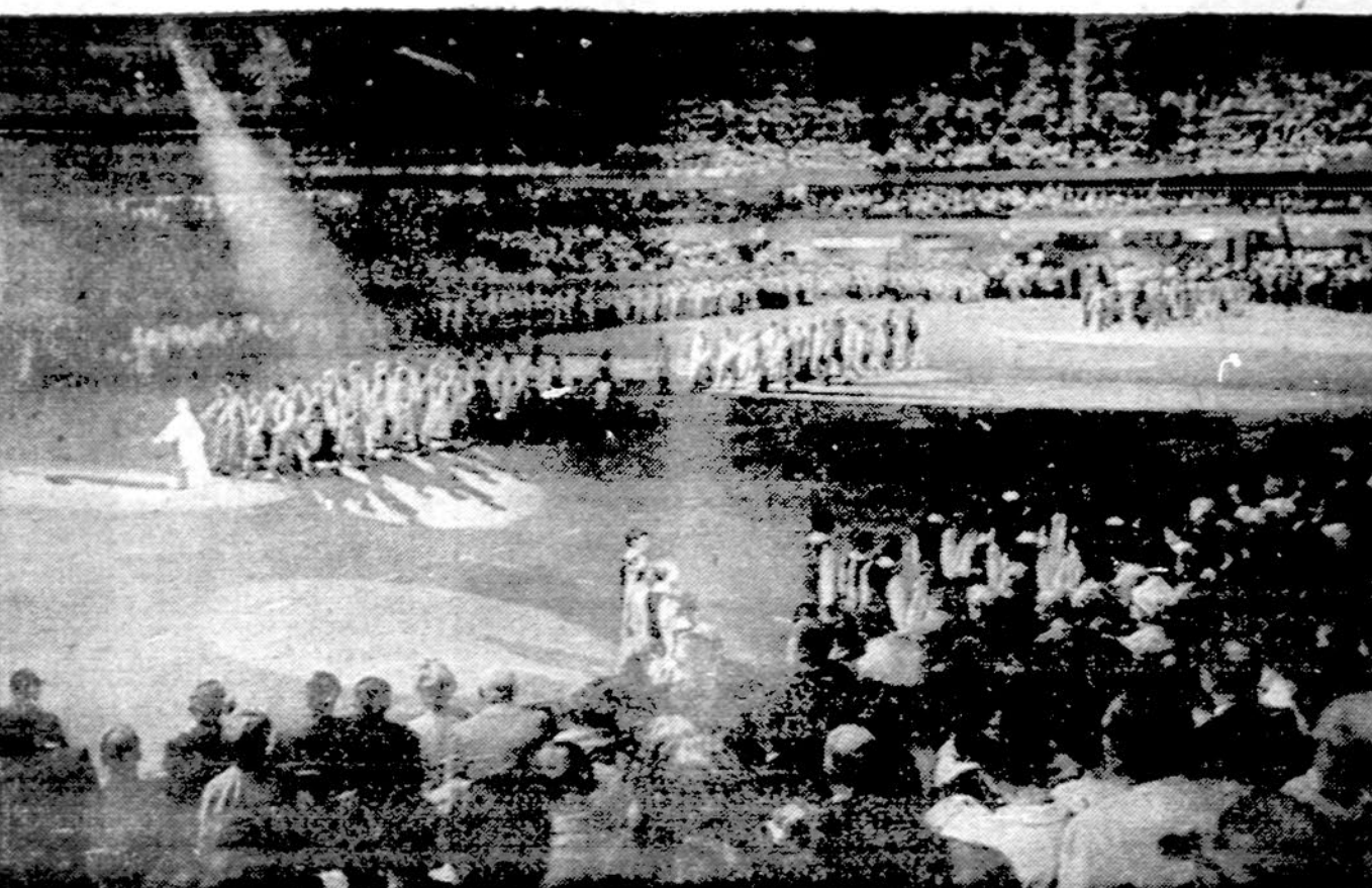
Artėja V-ji tautinių šokių šventė. Ji žada būti iškilminga ir įdomi. Čia matome mūsų tautinių šokių šokėjas, įžengiančius į amfiteatrą peritos šokių šventės metu.