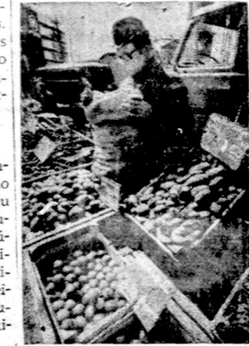
Dėl didelių sausrų Europoje gaunamas blagos derlius. Bulvių kainos pasoko dvigubai

Didžiausias aklųjų skaičius randamas Trečiajame pasaulyje, ir kas liūdniausia, kad, žinovu manymu, 2/3 jų būtų ga-