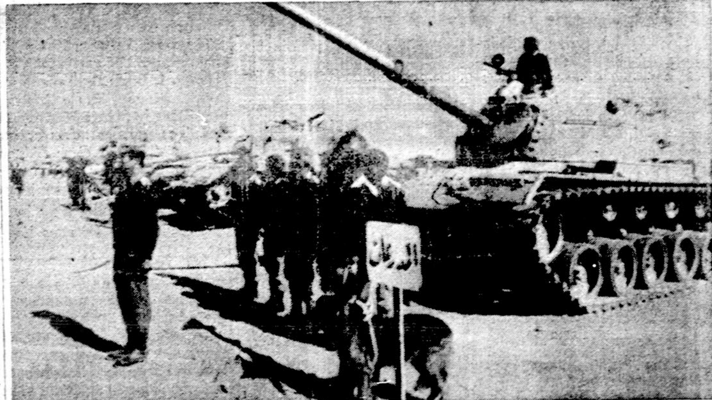
Egiptas giriasi turis tokias tvirtas karines pajėgas, kokių neurėjęs visoje savo istorijoje

— Tiesa — tai auksas, jos neperdirbsi. R. Tagore