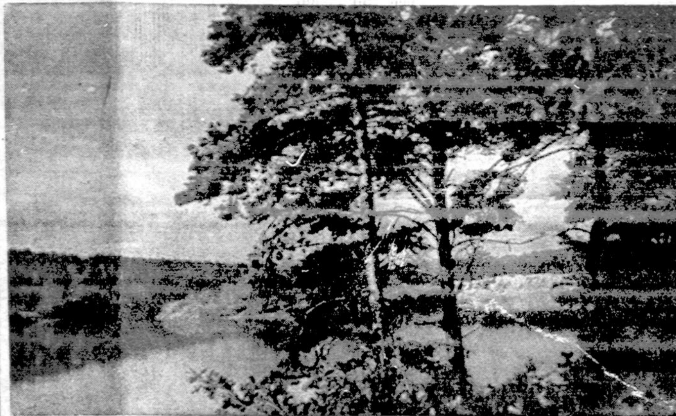
Nemunas ties Druskininkais