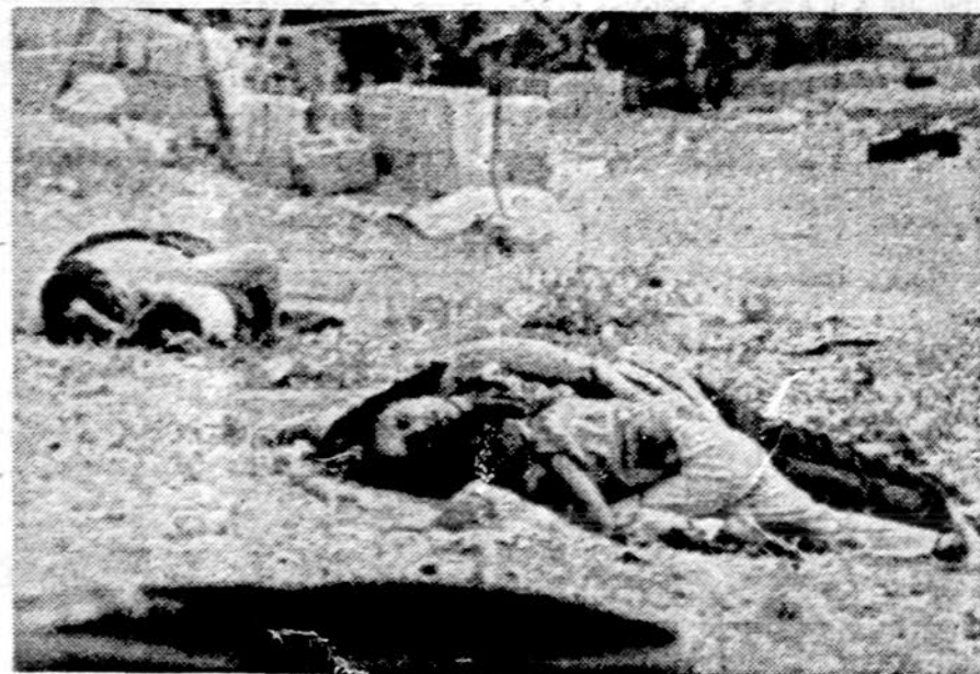
Kasdieninės pilietinio karo aukos Beiruto mieste, Libane.

Zambijos — Rodezijos pasienyje neramu. Mozambiko 800 mylių ilgio pasienyje jau seniai prasidėjo kovos. Kubiečiai paruošė Mozambiko kovotojų pradžioje siausti Rodezijoje, sprogdinti geležinkelio bėgius, užpildinėti traukiniuos, atlikti sprogdinimus net