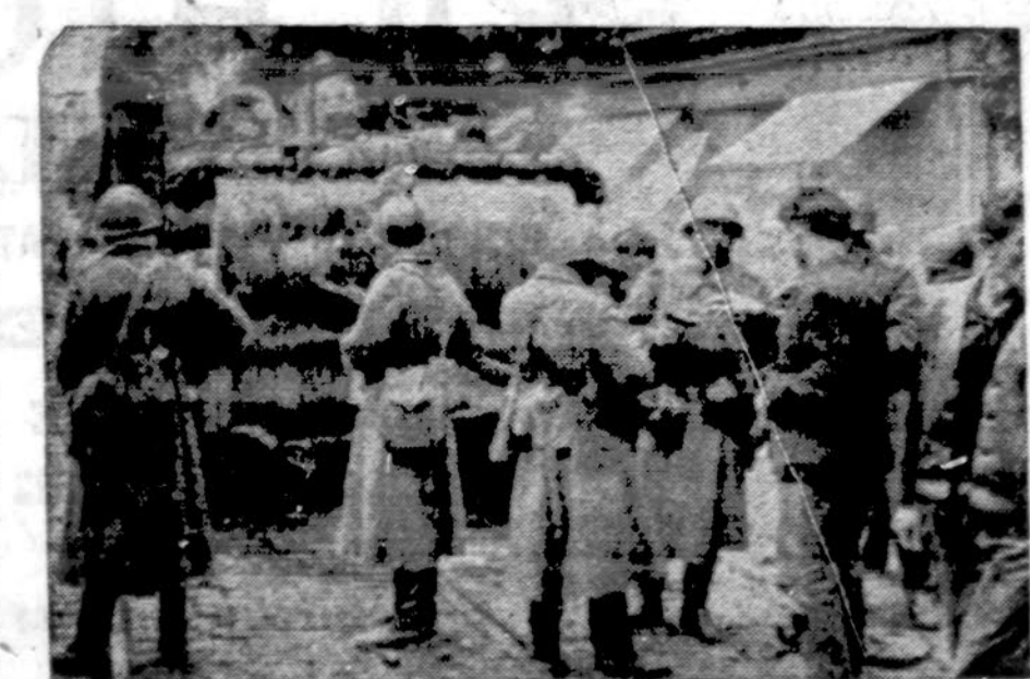
Tankai, durtuvai ir revolveriai — vienintelis sovietų argumentas. 1968 rugpjūčio 21 invazijai į Čekoslovakiją prisiminti.

Lenkijos ribose esanti arkivyskupijos dalis paskirstyta į 8 dekanatus ir 64 parapijas. Priklauso daugiau negu trys šimtai tikstančių tikinčiųjų, kuriuos dvasiniai aptarnauja 250 kunigų. Čia taip pat veikia aštuonios seserų vienuolių kongregacijos, turinčios 22 centrus.