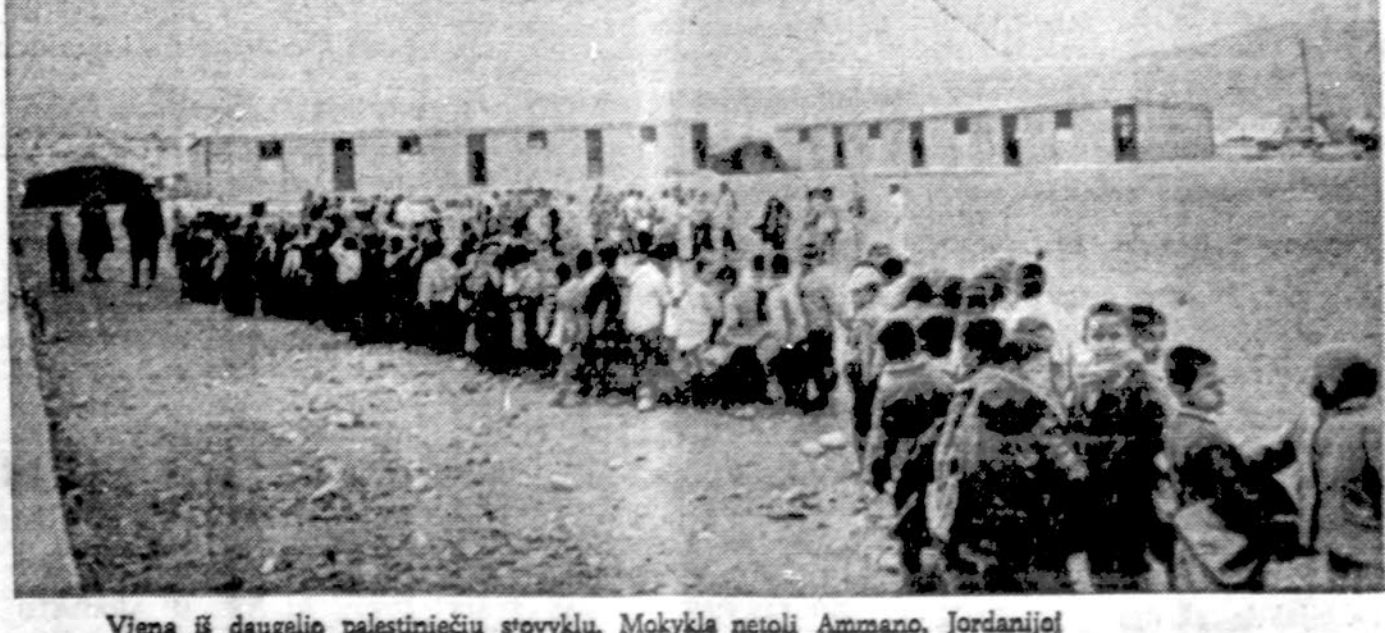
Viena iš daugelio palestiniečių stovyklų. Mokykla netoli Ammano, Jordanijoj

Po konvencijos buvo apklausi nėti buvę Reagano šalininkai, užklausti, ar jie remia Fordo-Dole sąrašą. 80% atsakė remsią, su kitais neaišku arba atsakymas buvo neigiamas.