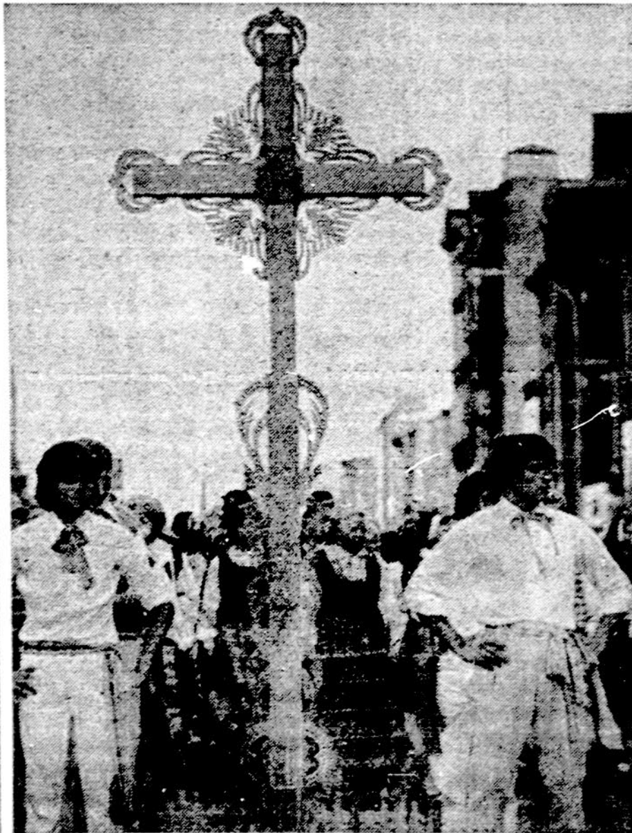
Lietuvių parapiljos Philadelphiaje, dalyvavo Tarptautinio Eucharistinio kongreso parade, vykusiame rugpiučio 1 d. Siame parade dalyvavo daugiau nei trečdalis milijono žmonių. Nuotraukoje, šv. Andriejaus parapiljos lietuviai neša kryžj.