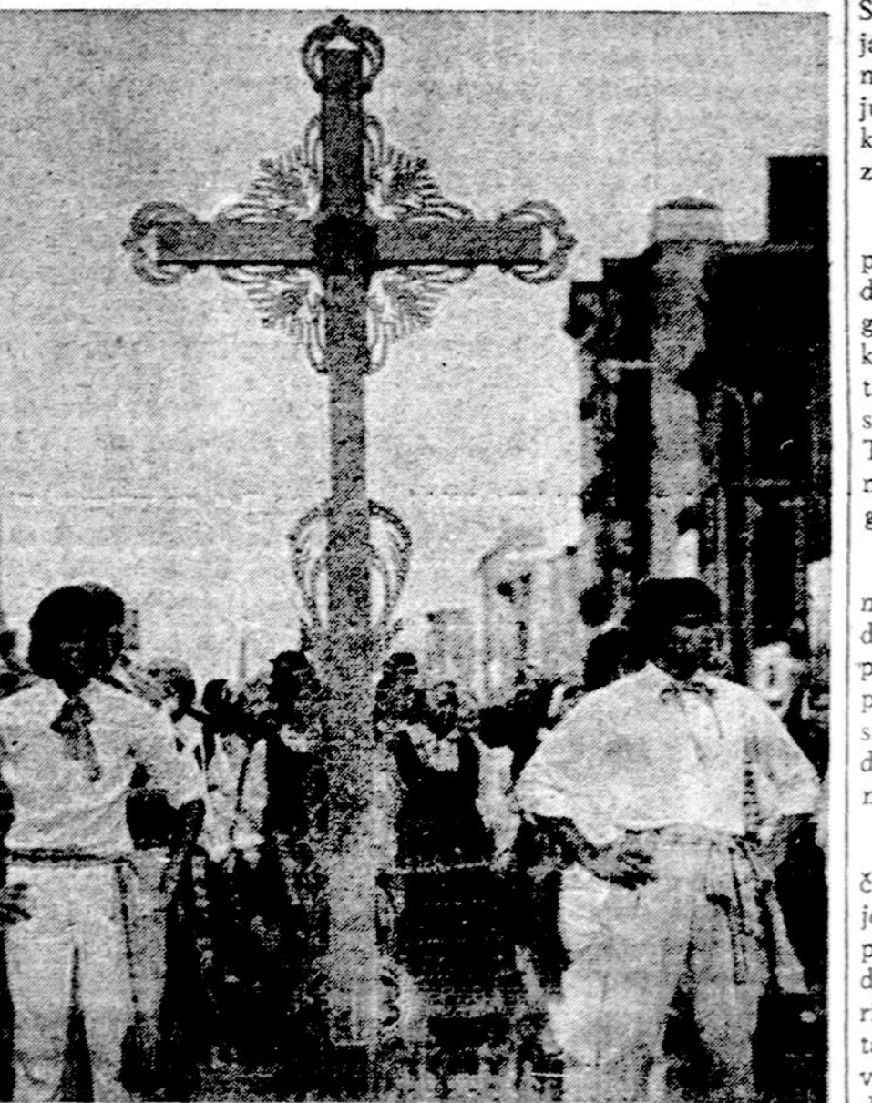
Lietuviū parapjios Philadelphiajē, dalyvavo Tarptautinio Eucharistinio kongreso parade, vykusiame rugpiūčio 1 d. Siame parade dalyvavo daugiau nei trečdalis milijono žmoniū. Nuotraukoje, šv. Andriejaus parapijos lietuviai neša kryžiū.

dū artėjant dviejū metų sukakčiai, kuri bus paminēta 1977 m. Belgrade. Bet pavergtiesiems nematyti jokiū prosvaitėiū. Komunistinė vergija nelengvėja okupuotoje Lietuvoje, nes jos okupacija yra Helsinkio aktu tik sustiprinta.