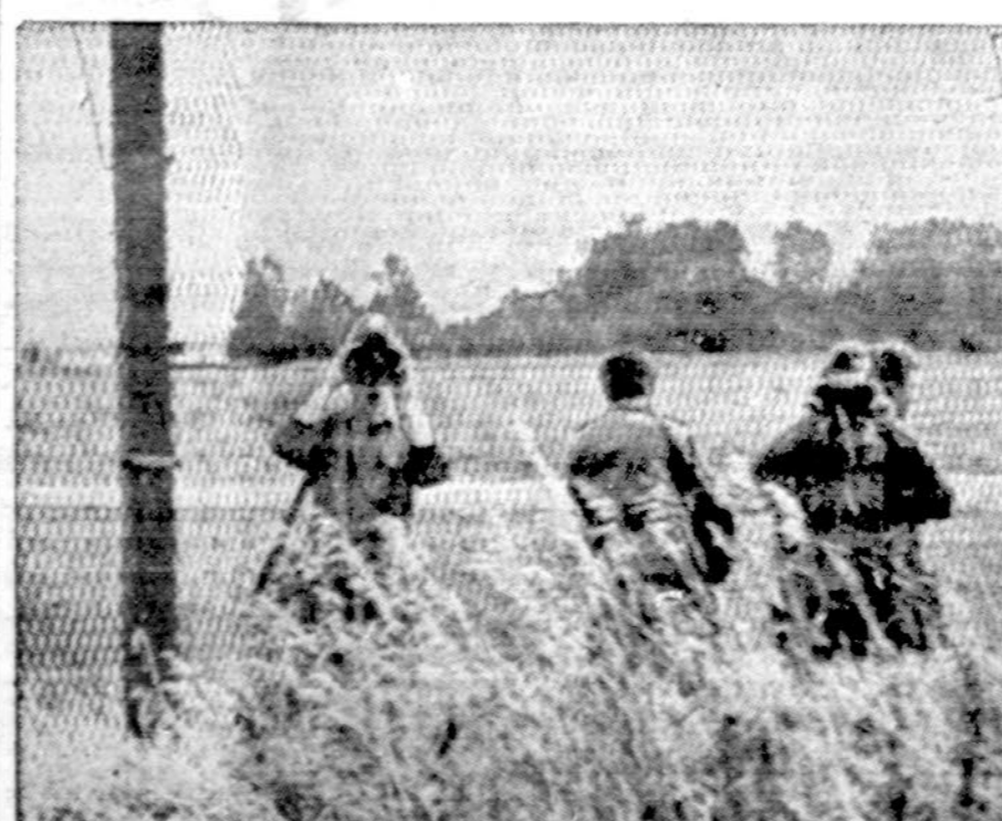
Nepereinamoji siena tarp abiejų Vokietijų. Kitoj pusėj geležinio tinklo Rytų Vokietijos sargybiniai per žiūrus seką kas darosi Vakaruose.

Beirutas. — Nuo Libano civilinio karo p-adžios užmuštų skaičius jau pasiekė 40,000, arba per 17 mėnesių vidutiniškai kasdien žūsta po 80 žmonių.