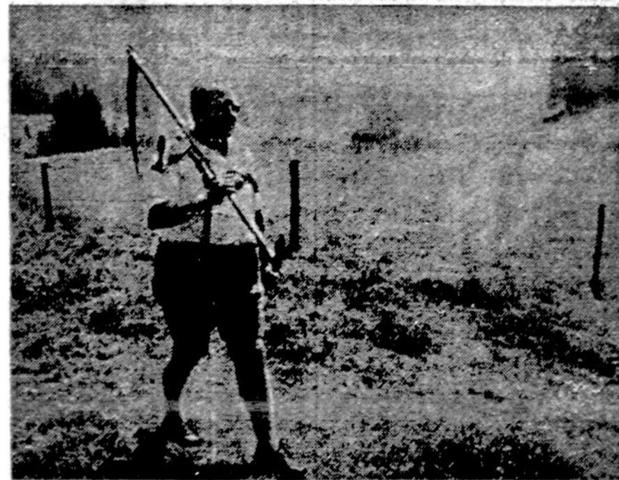
Vakarų Vokietijos žemės ūkio ministeris Erū labai apgailėstauja, kad smarkios vasaros kaitros ir lietus stoka labai pakenkė žemės ūkiui. Ne laiku teko išskęsti daug gyvulių, nes trūko pašarų. Maisto produktų kainos labai iškėlo.