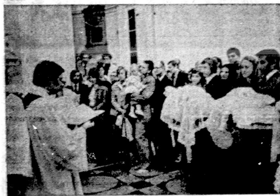
Krikšto sakramento teikimas komunistinėj Lenkijoje.

Daugiausia saulėta, vėsiu, 30 proc. galimybė lietus su perkūnija, apie 82 laipsniai.