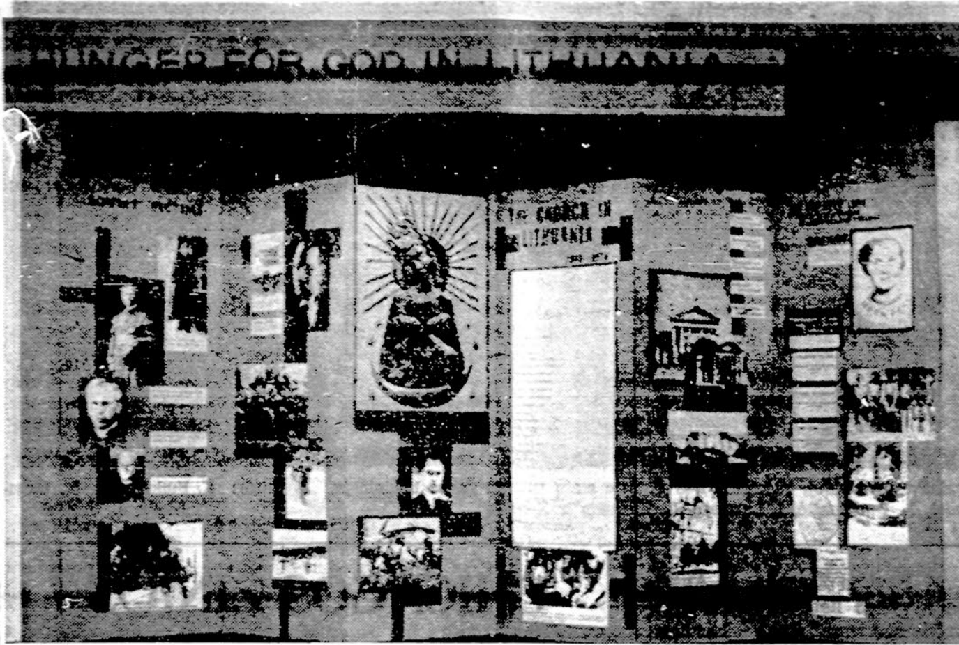
Eucharistiniame kongrese Philadelphiajį išskirtiną lankytųjų dėmesį patraukė parodos lietuvių skyrius, pavadintas Hunger for God in Lithuania.

Nuo 1918 m. iki šio laiko įvyko Linkuvos visuomenėje kartų pasikeitimas. Senieji veikėjai vienas po kito pasitraukė į amžinybę. Jaunoji karta užėmė jų vietas. Pamažėle, audringu įvykių sūkuryje, grimsta į užmaršį įvykiai, faktai, žmonės. Kas senajai kartai tebėra dabartis, tas naujajai jau yra istorija, seniesiems amžininkai dar jaučiami kaip gyvi, jaunesiems mirusieji jau yra pavirtę žvejančiais iš knygų nuotrauka. Tai senas bėgančio laiko nepakeičiamas dėsnis. Jis keičia žmonių veldus, vardus ir įvykius spalvina naujomis varšomis ir tikrovę pagražina ornamentais. O vis dėlto jaunystės prabėgusios, audrų ir viesulių palydėtos dienos visados grįžta šviesiais atsiminimais į samonę. Šie atsiminimai mus skatina ir įpareigoja Linkuvos aplinkumoje prieš 600 metų prasiidėjusių senųjų lietuvių žiemgalių istoriją pratęsti, kad linkuvių po mūsų ateinanti karta galėtų prisiminti mus, kad mes