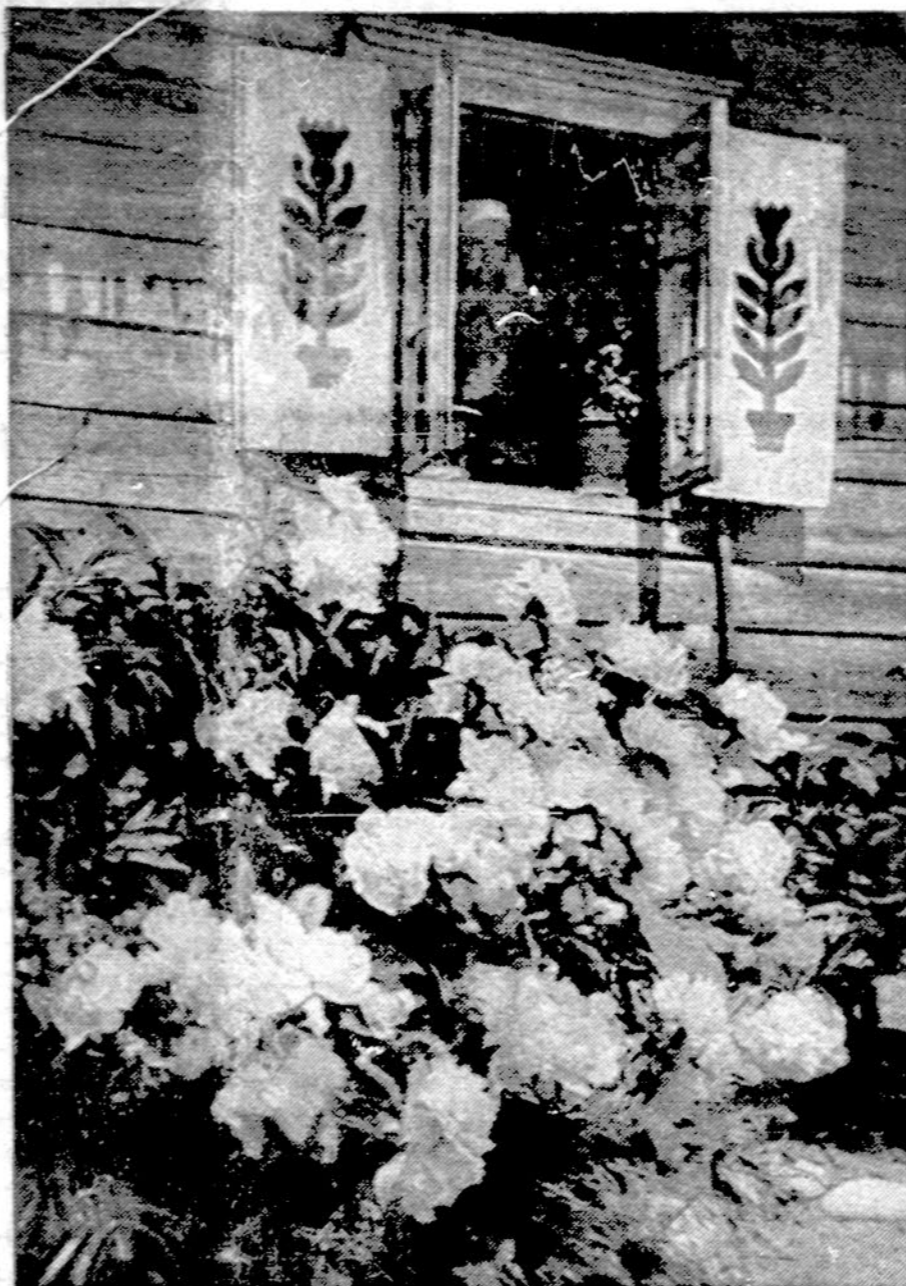
Praėjo bijūnai po langu.