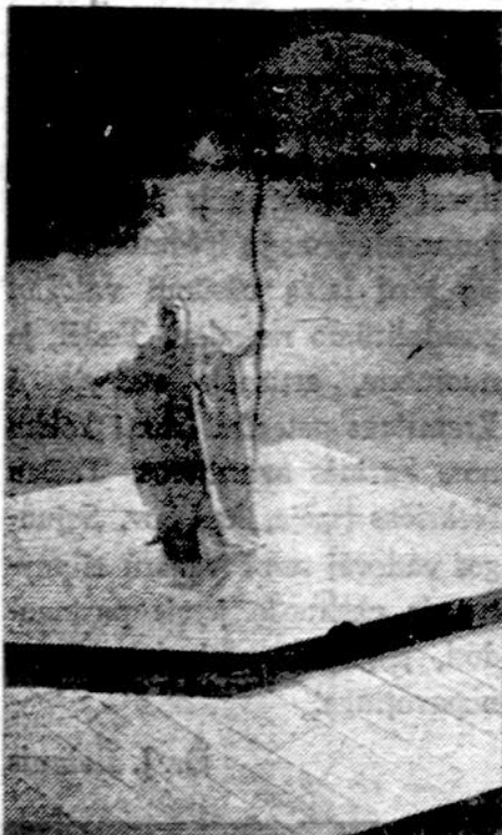
William Hutt Prospero vaidmenyje Sekspyro "Audroje" Stratforde (Kandaje).

Po to įvykio Čepurna pajuto, kad jį veja iš Berlyno ir tie geltonieji jazminai, ne tik artėjas frontas. Kur tik jie sugeltonuoja prieš akis, Čepurna ir mato džiaugsmingą Adomo veidą prie krūmo, pusę galvos, duobę ir koją. Net ir ilgi metai nepajėgė išdildyti to vaizdo.