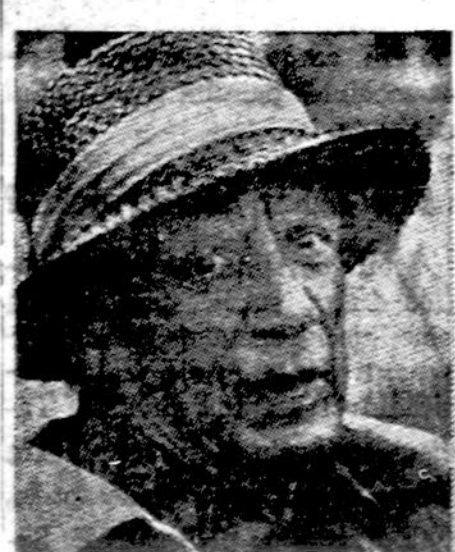
Pablo Picasso (katalonas, 1881-1973)

Švedų rašytojas Eyvind Johnson, kuris 1974 m. su kitu laimėjo literatūros Nobelio premiją, mirė rugp. 25 d. Sockholmo ligoninėje, sulaukęs 76 m.