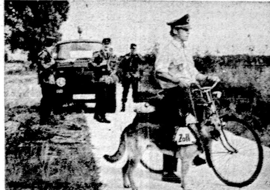
Vakarų Vokietijos muitininkai su specialiai šiam reikalui paruoštais šunimis seka pasienio judėjimą ir gauda narkotikų platintojus.

Nešališkieji kraštai siekė skolų panaikinimo ar bent jų įšaldymo. Jiems parūpo kuo pigiau pramonės gaminius pirkti ir brangiau žaliavas parduoti. Jie kalbėjo apie atitinkamą ūkinę organizaciją gamybai derinti, užsienio prekybai ir finansams