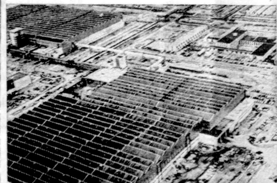
Prancūzija plečia atominės energijos tyrimus ir gamybą taikos reikams. Nuotraukoj jų juostas modernus atominis centras, kurį jie laiko savo krašto ūkiniu triumfu.

WASHINGTONAS. — Rugpjūčio mėnesį bedarbių procentas pakilo iki 7.9. Prez. Fordas per daug nenusimena, sako, jog tai laikinas reiškinys, iki metų pabaigos procentas bus ne didesnis kaip 7. Skaičiais bedarbių 7,506,000, daugiausia ne kvalifikuotų juodųjų, ir jų procentas yra 13.6.