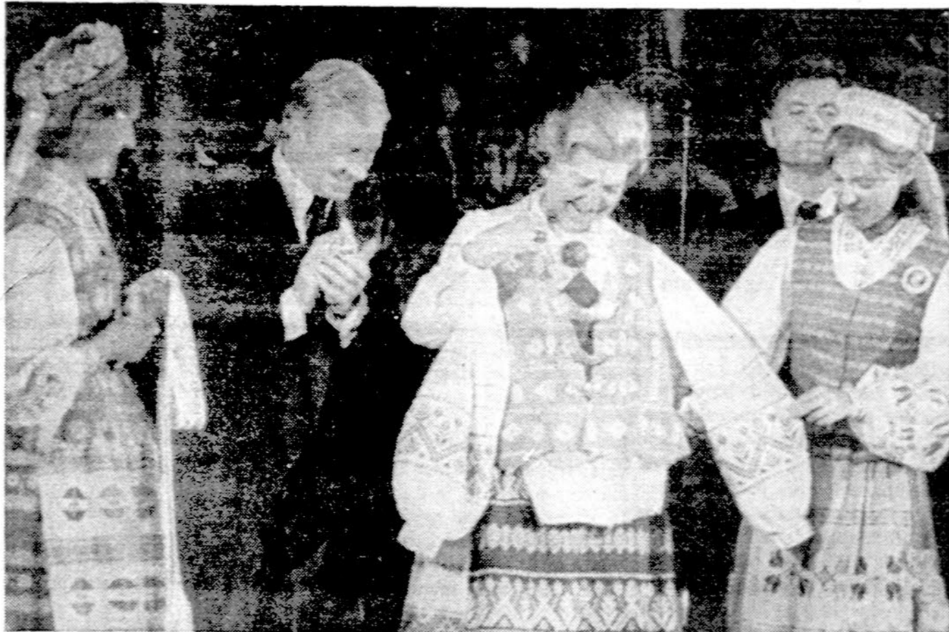
Mrs. Betty Ford su lietuviškomis apžiūri jai dovanotą lietuvių tautinį kostiumą. Šalia jos senatorius Charles Percy ir Valdas Adamkus