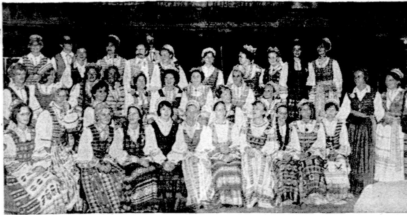
Lietuvių tautinių šokių grupių vadovės, kurių didelio darbo bei pasiaukojimo dėka buvo paruošta V-jai taut. šokių šventei apie 2000 įvairaus amžiaus šokė

× RUDUO YRA SPALVŲ LAIKAS — gamtoje, aprangoj, namų dekoravime. Atvykite ir pamatysite gražiausių namų dekoravimui pavyzdžių moterų rankų darbo parodą rugsėjo 17—18—19 d. J. Centre. (pr.)