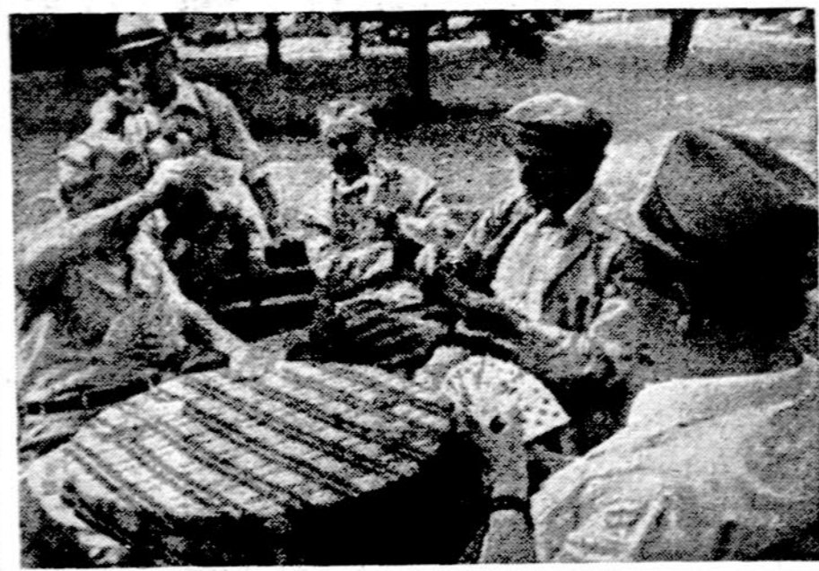
Vakarų Vokietijos pensininkai nerūpestingai leidžia savo laiką

Gana įnoringai penktajai Prancūzijos respublikai jau supiltas kapas. Kas per viena bus ta šėto-damas Prancūzijos didybės 1966 m. atšaukė Prancūzijos kariuosi