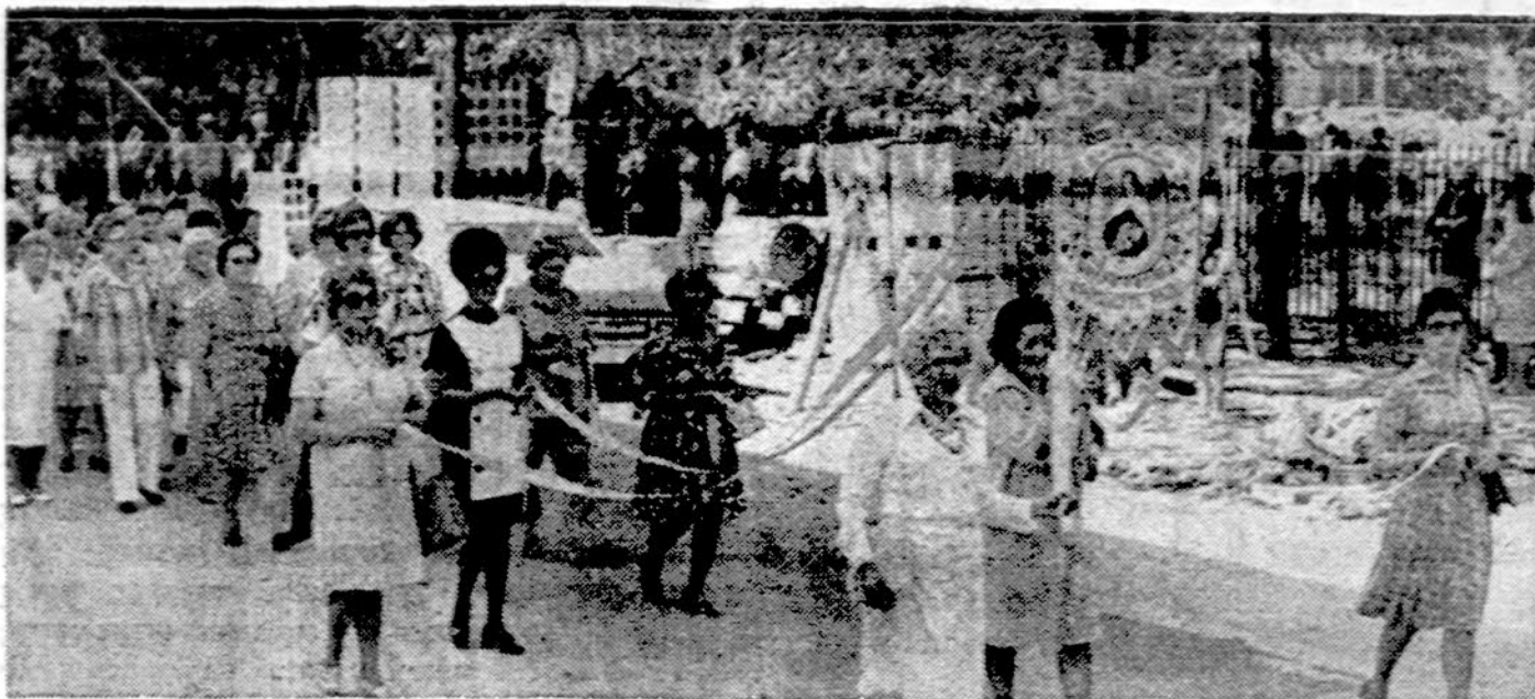
Svč. M. Marijos Gimimo parapijos Sv. Teresėlės draugijos narės su savo vėliava Siluvos atleidų procesijoje

× NAMAMS PIRKTI PASKOLOLOS duodamos mažais mėnesiniais įmokėjimais ir prielaimais nuosimčiais Mutual Federal Savings 2212 West Cermak Road. Telefonas VI 7-7747. (sk.)