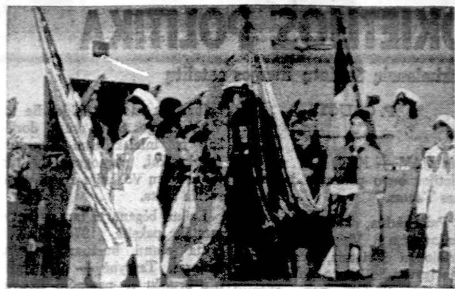
Įnešamos vėliavos Clevelando skautų-čių iškilmingon sukakruvinėn sueigon.

maldu šv. Jurgio bažnyčioje, palaidotas Visų Sielų kapinėse. Išėkis ramybeje, Ignai, toli nuo mylimos Lietuvos, į kurią vis tikėjai sugrįžti!