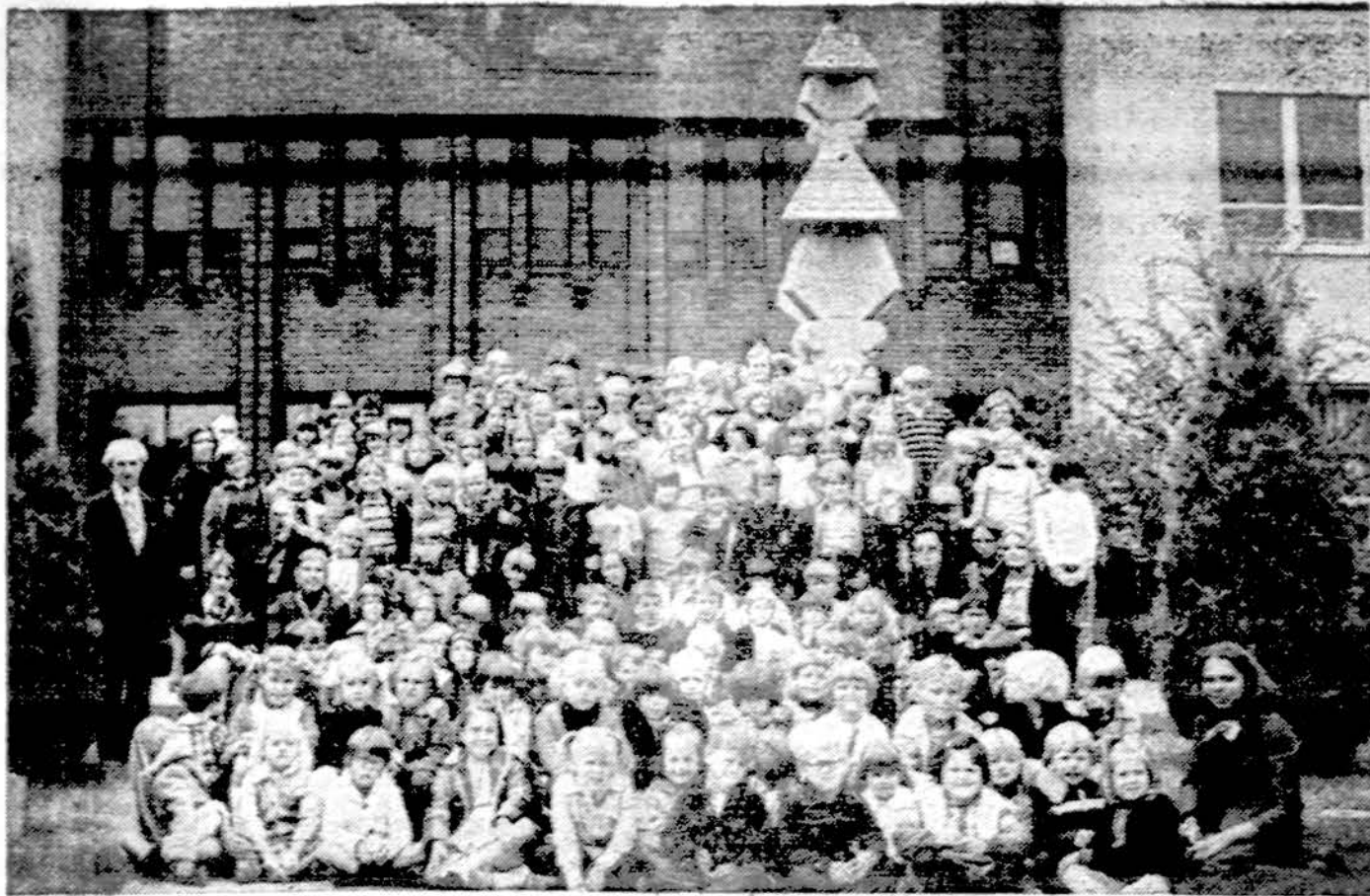
Dariaus Girėno lituanistinė mokykla pradėjo 1976-77 mokslo metus su žymiai padidėjusiu mokinių skaičiumi. Nuotraukoje mokiniai ir mokytojai.