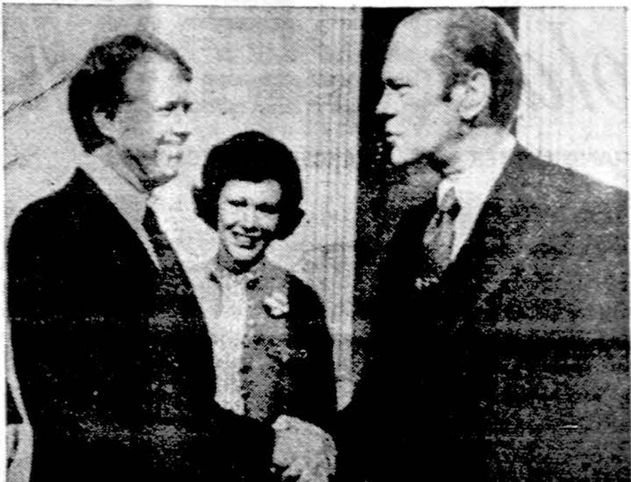
Po antrųjų debatų prez. Fordas ir Jimmy Carter. Abu stebi Carterio žmona.

kitas Lietuvos dainas bei kitokiais būdais reišė savo entuziazmą, kuriam sutrukdyti milicija ir civiliai apsirėngę saugumiečiai panaudojo jėgą. Tačiau tai tik suardino minia, kuri stichiškai susiorganizavo ir apie 2000 žmonių eiseną, beveik išimtinai jaunimas, apskusiu du ratus stadijono, patraukė į miesto centrą, skanduoama „Žalgiris!“ ir deimodama Lietuvos dainas. Ši eiseną, nors pretekstas jai atsirasti buvo puiki „Žalgirio“ pergalė, vėliau virto tam tikra protesto ir Vilniaus lietuviškojo jaunimo nuotaikų demonstracija. Eiseną, perėjusi centre gatve (buvo bandyta ją išskirstyti ties Dzeržinskio tiltu, bet nepavykusi, apskusiu kvartala aplink Saugumo komiteto pastatą ir švilpimu bei šūksniais „pagerbui“ už užuolaidų pasislėpusius saugumiečius, buvo išvaikyta stambių milicijos bei saugumo pajėgų ir iškvieštų Vilniaus igulos kariuomenės spec. dalinių. Kai kuriuos eisenos dalyvius suėmė.