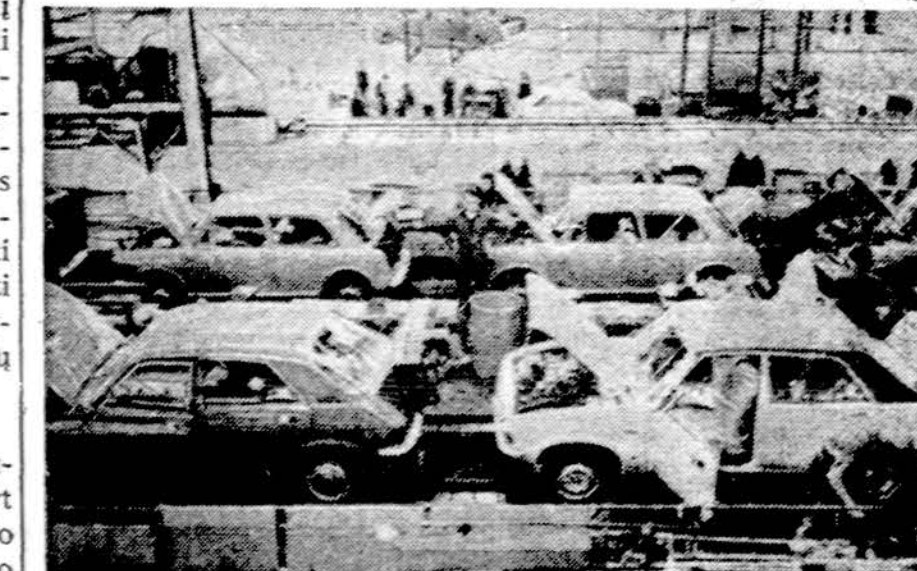
Anglijos automobilių fabrikai pagamina daug automobilių, tačiau pasaulinėje rinkoje jie neišlaiko konkurencijos su vokiečiais, italais ir japonais, nes šių kraštų fabrikai gamina žymiai pigiau

R. Vokietija, būdama dešimtoji savo pramonės pajėgumu pa-saulio šalis, stengiasi pakelti savo piliečių gyvenimo lygį, kuris yra aukščiausias visam Sovietų bloke. Kadangi gyventojų priea-uglis vis mažėja, valdžia pradė-jo masinę namų statybą, kad pa-