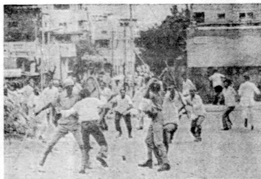
Indijos premjerė Indira Gandhi ne taip jau švelnia moteriška ranka valdo kraštą. Šiuo metu Indijos 1159 kalėjimuose laikoma 59,000 poli- tinių kalinių. Vak. Europos spauda skelbia, kad jie ten esą labai kan- kinami. Nuotraukoj Indijos policija maišina studentų riaušes, nukreip- tas prieš premjerę

1972 metų Olimpiadoje pale- stiniečiai teroristai nušovė 10 Izraelio atletų ir vieną vokiečių policininką.