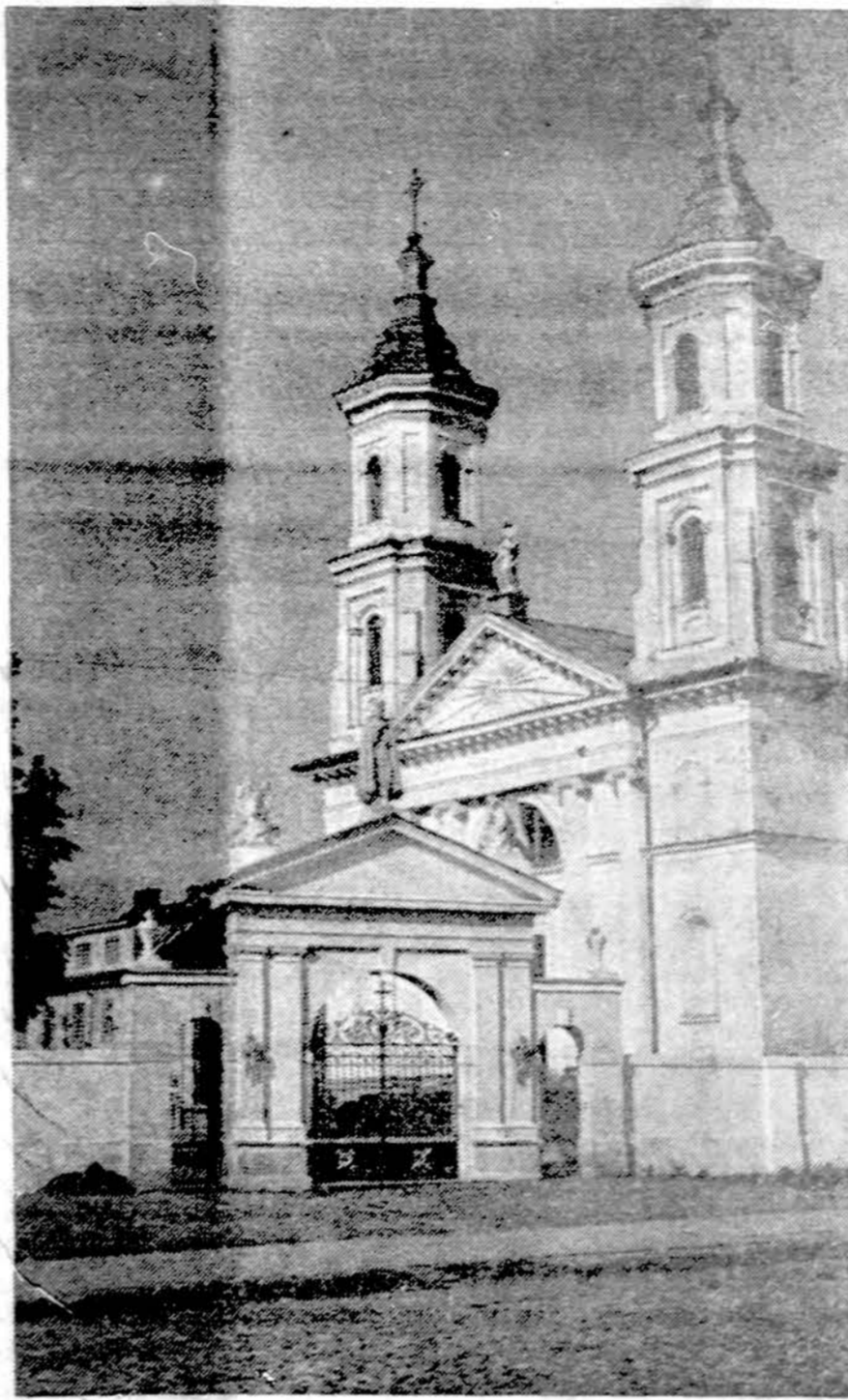
Suvalkų Kalvarijos bažnyčia. Prieškarinė nuotrauka