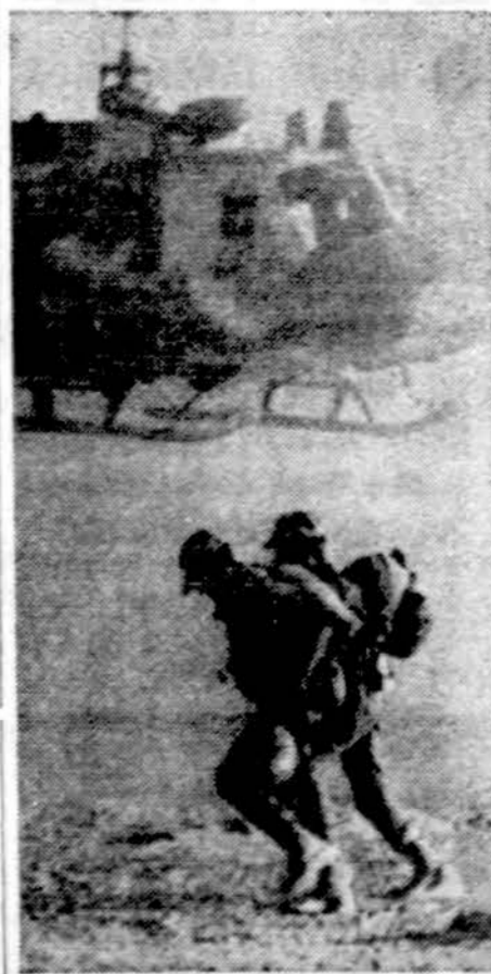
Izraelio paraštininkai, mirties komanda, naudojama pagrobtyjų va- davimui.