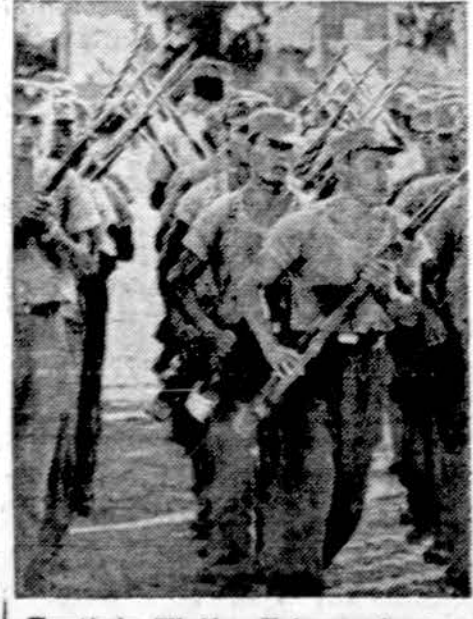
Tautinės Kinijos Taiwanio karių

Stockholmas. — Švedijos premjero Thorbjorn Faellidno vyriausybė yra 5 moterys, tarp jų ir užsienio reikalų ministerė, 48 metų, Karin Soder.