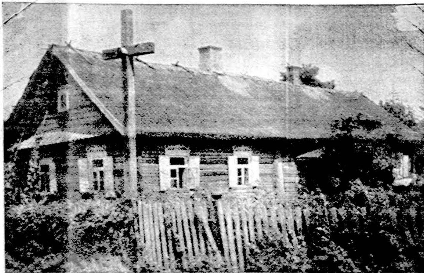
Mūsų senas, idiliskas Aukštaitijos (Ramygalos vis., Pnevėžio aps.) kaimas. Ar to kryžiaus statytojai galėjo tikėtis, kad jų vaikai bus dėl jo persekiojami?