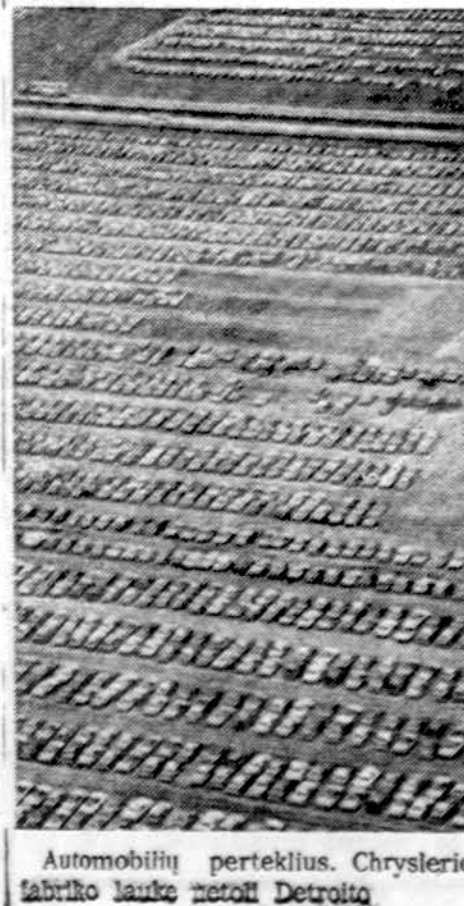
Automobilų perteklius. Chryslerio fabriko lauke netoli Detroito

Amerikiečiai iš savo pusės skundžiasi rusais. Daromi visokie sunkumai jūrininkams išlipiti į krantą. Kartais tenka laukti visą savaitę, kol rusų laivai atplaukia ir paima norinčius išlipiti.