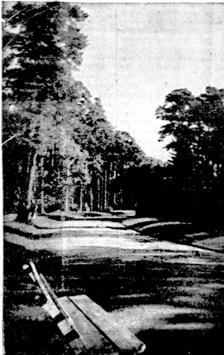
Palanga. Išniekinta ir sudaužyta Kristaus statula prie Tiškevičiaus rūmų ir parko kempelis. Prieškarinės nuotraukos