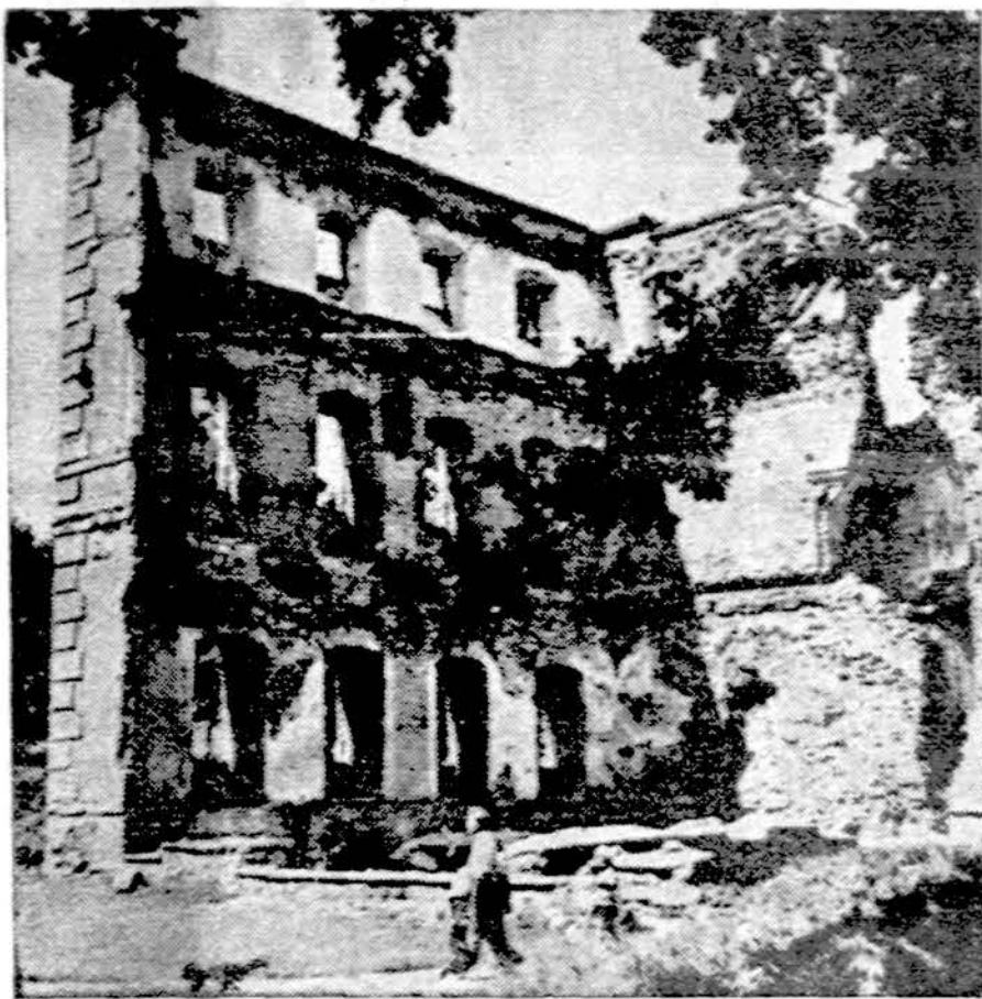
Biržų pilies griuvėsiai

1976 kovo 27 vėl buvo įsilaužta į Aukštėklės bažnyčią. Išbrovėliai, atrodo, ne tiek vagys, kiek krėtėjai. Jie peržiūrėjo spintoje esančias gaidas — matyt ieškojo draudžiamos literatūros.