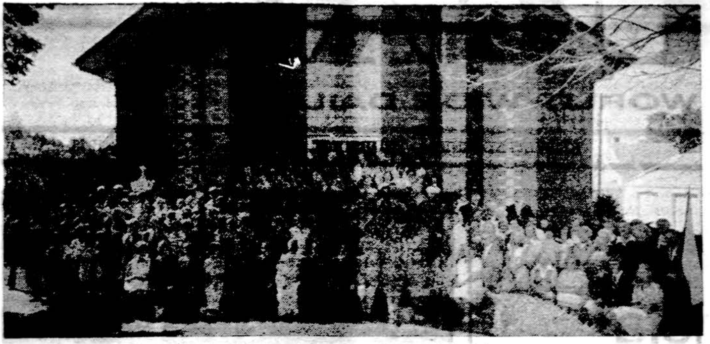
63-ojo Lietuvos vyčių seimo Daytono dalyviai