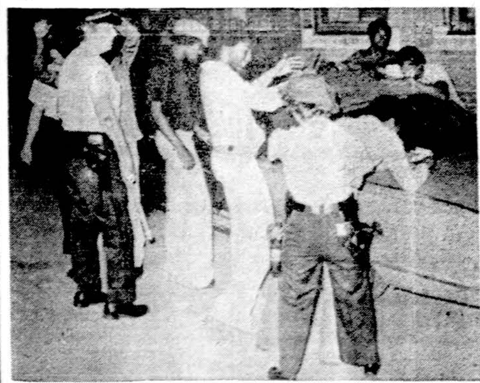
Detroito policija stropiai tikrina jaunuolius, įtartus narkotikų vartojime ar prekyboje

Keistojo reiškinio priežastis kol kas neišaiškinta, jis labai sudomino mokslininkus ir kriminalistus. jm