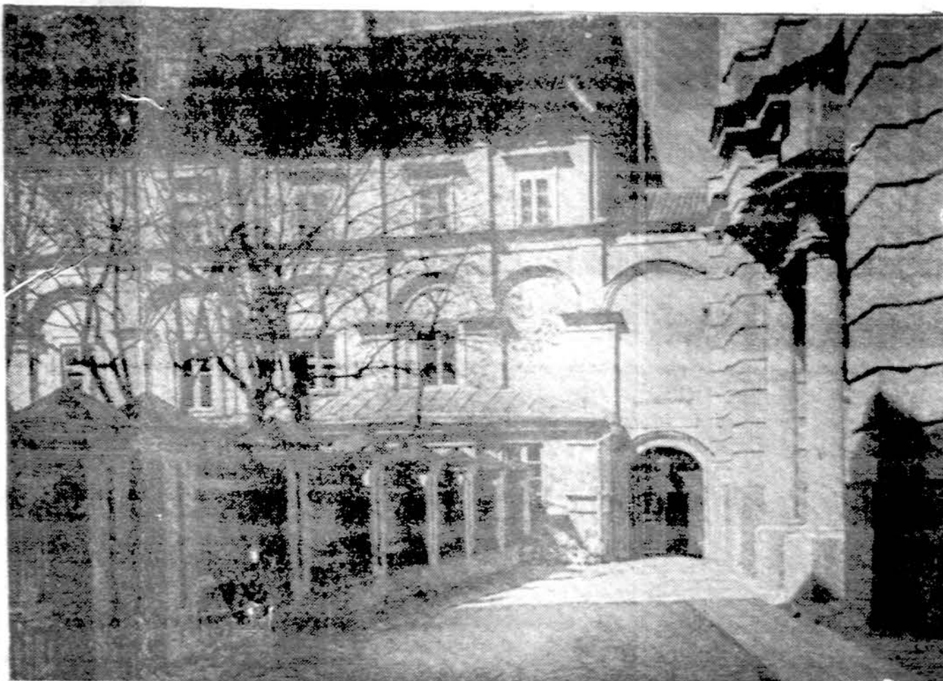
Vilnius. Įėjimas į Šv. Jono bažnyčią

Mažeikių ir Vieksnių kapinėse sudaužyti paminklai ir nuplėštos kančios nuo kryžių. Kodėl valdžia nemato chuliganų, o persekioja vaikus, lankančius bažnyčią?