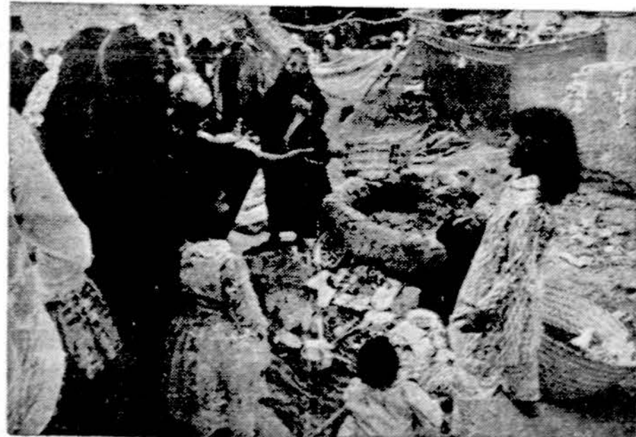
Egiptiečių vaikai mėgina užsidirbti prekiaudami

Manila. — Filipinų referendumas rodo, kad 92.88 procentai piliečių pritaria prezidento Marcos griežtai linijai, karo stovui.