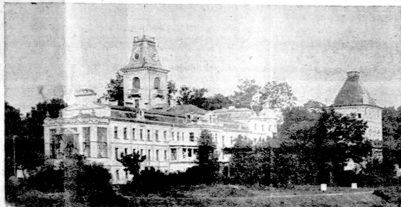
Kėdainių dvaro rūmai, miesto papuolas. Nepriklausomybės laikais juose buvo Aukštesnioji kultūrtechnikos mokykla. II Pasaulinio karo metu vokiečių kariuomenė besitraukdama rūmus susprogdino, o naujieji okupantai rusai jų atstatyti neleido.