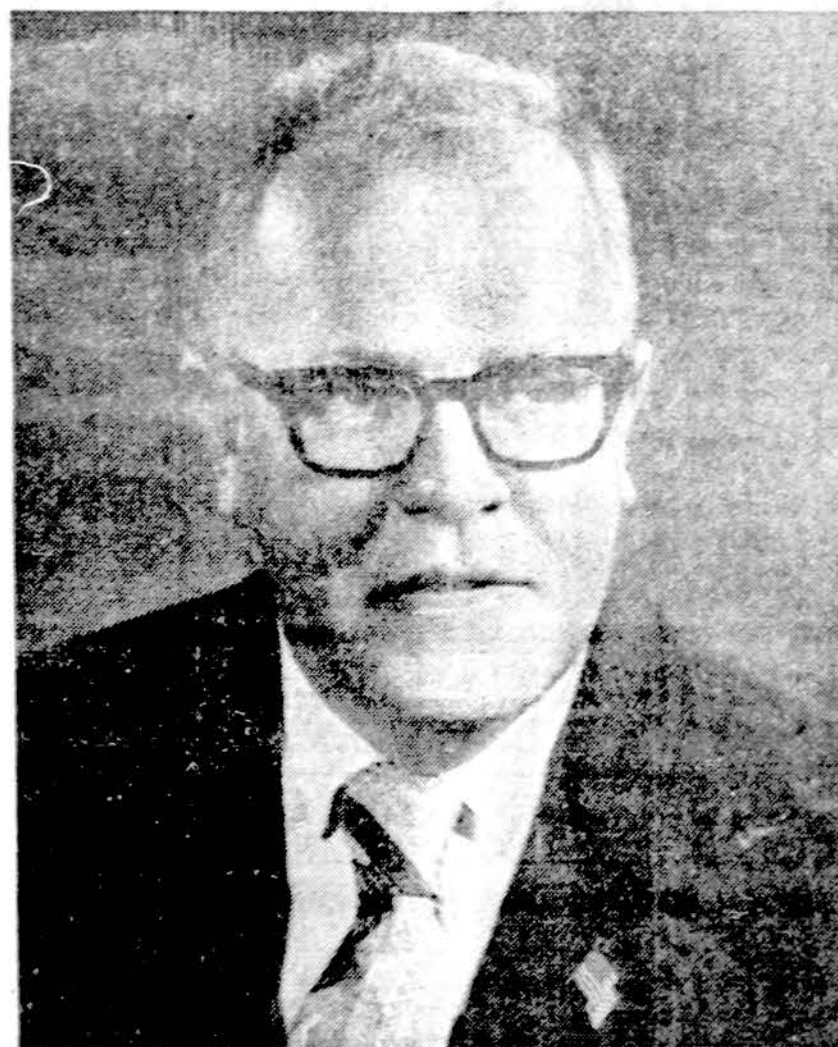
EDWARD J. DERWINSKI

Demokratų kandidatas į kongresą 11 distrikte