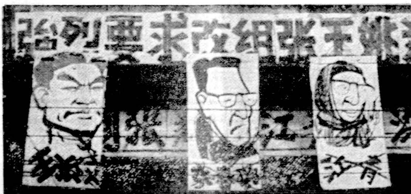
Mao našlės Čiang Čing ir kitų nuvainikuotų kinų rad. kalbų, politinio biuro narių, karikatūros Sanchajaus gatvėse

Marselis. — Didelis lietus Pietinėje Prancūzijoje ir Korsikos saloj sukėlė potvynius, daugelį kaimų atskyrė nuo pasaulio. Trys žmonės nuskendo.