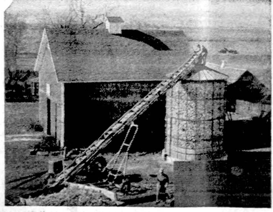
Amerikos ūkininkai krauna savo derlių žiemai

Beirutas. — Po 9 dienų pailaubų kovos Beirute atsinaujino. Iš abiejų pusių buvo panaudoti mortarai ir tankai. 45 žmonių buvo užmušti.