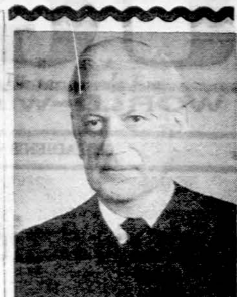
BALSUOKITE ZALIAI "TAIP"