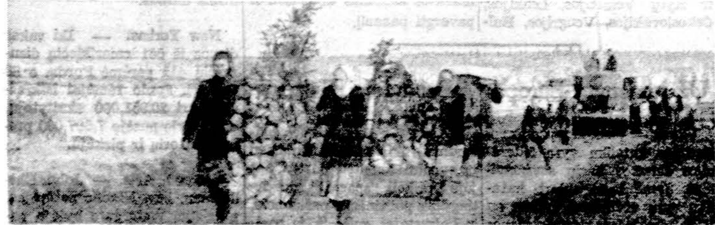
Lietuvio ūkininko - tremtinio laidotuvės Sibire, 1963 metais