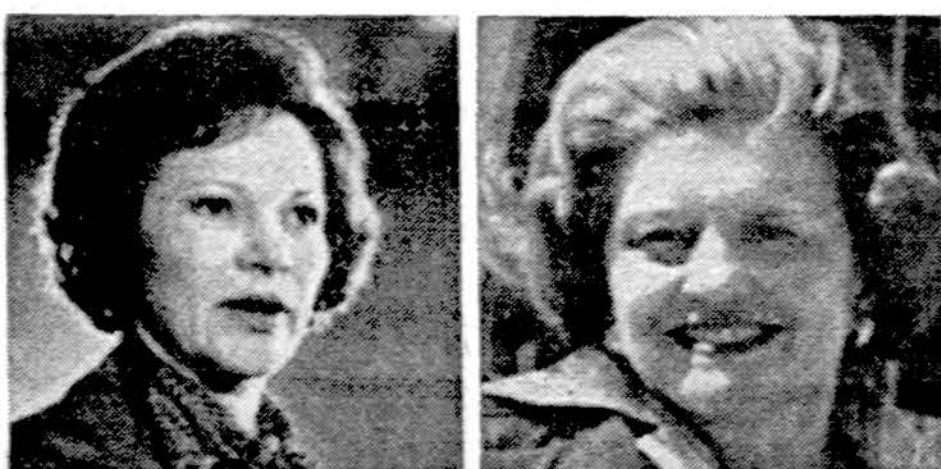
Mrs. Rosalyn Carter