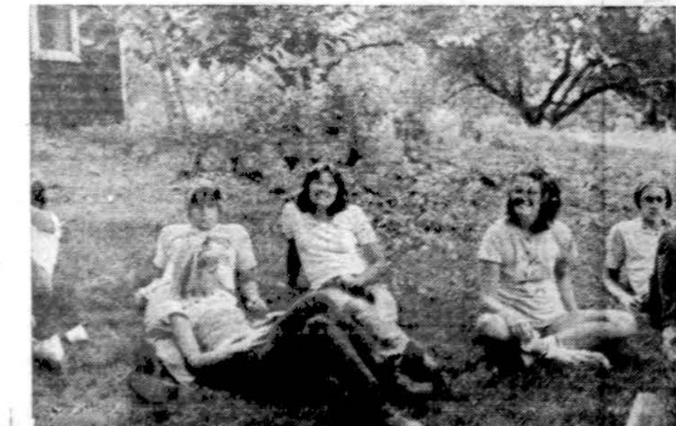
O po rimto darbo — linksmas laisvalaikis ir poilsis...