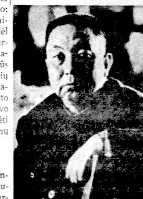
Mao įpėdinis Hua Kuo-feng

Tailandas yra svarbus pietrytinės Azijos kraštas geopolitiniu požiūriu. Jis priklauso pietrytinės