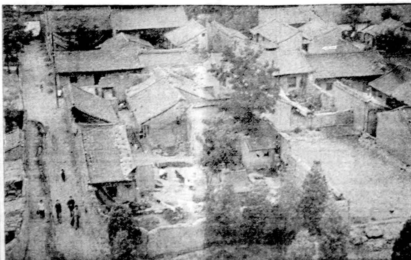
Būdingas Kinijos kaimelis

BRIUSELIS. — Nežiūrint Fidel Castro pažado karių skaičių Angoloje sumažinti ir visai atitraukti, kubiečių skaičius padvigubėjo, sako, Holder Roberto, Angolos Tautinio išsilaisvinimo fronto prezidentas. Dar jis sakė, kad kubiečiai apšaudė kaimelius, kurie nepareišia visiško lojalumo komunistiniam režimui.