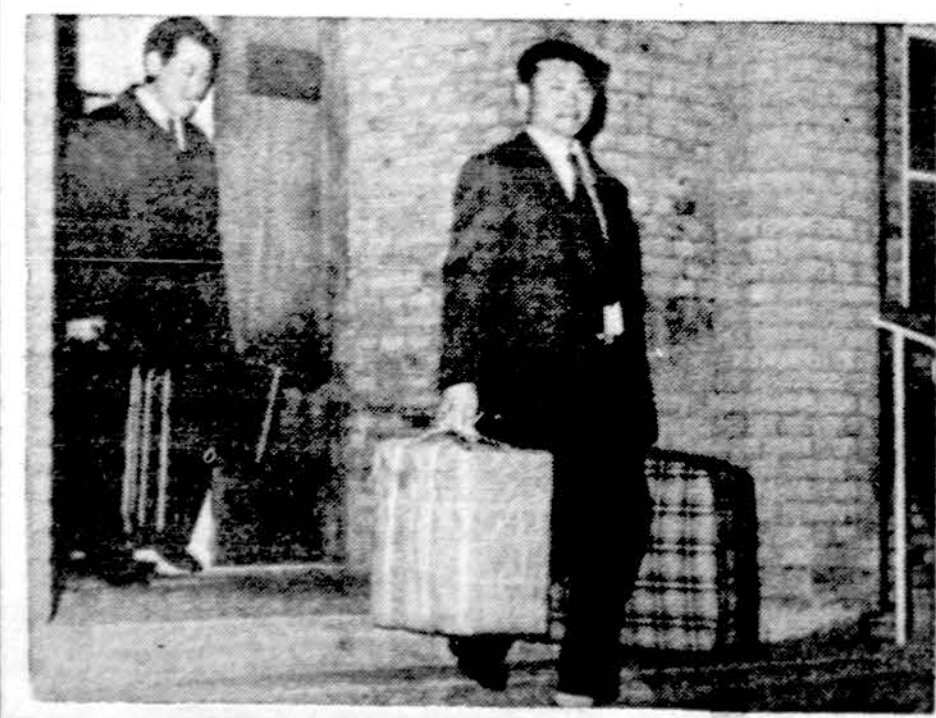
18 Danijos išvažiuoja šiaurės Korėjos diplomatai. Buvo išvaryti už narkotikų, likerių ir cigarečių šmugelį

Washingtonas. — Allstate kompanija nori pakelti draudimo mokesčius mažiems, kompaktiniams automobiliams. Mažai automobilių daugiau nukentčia nelaimės atveju ir yra dažnesniu taikiniu vagims.