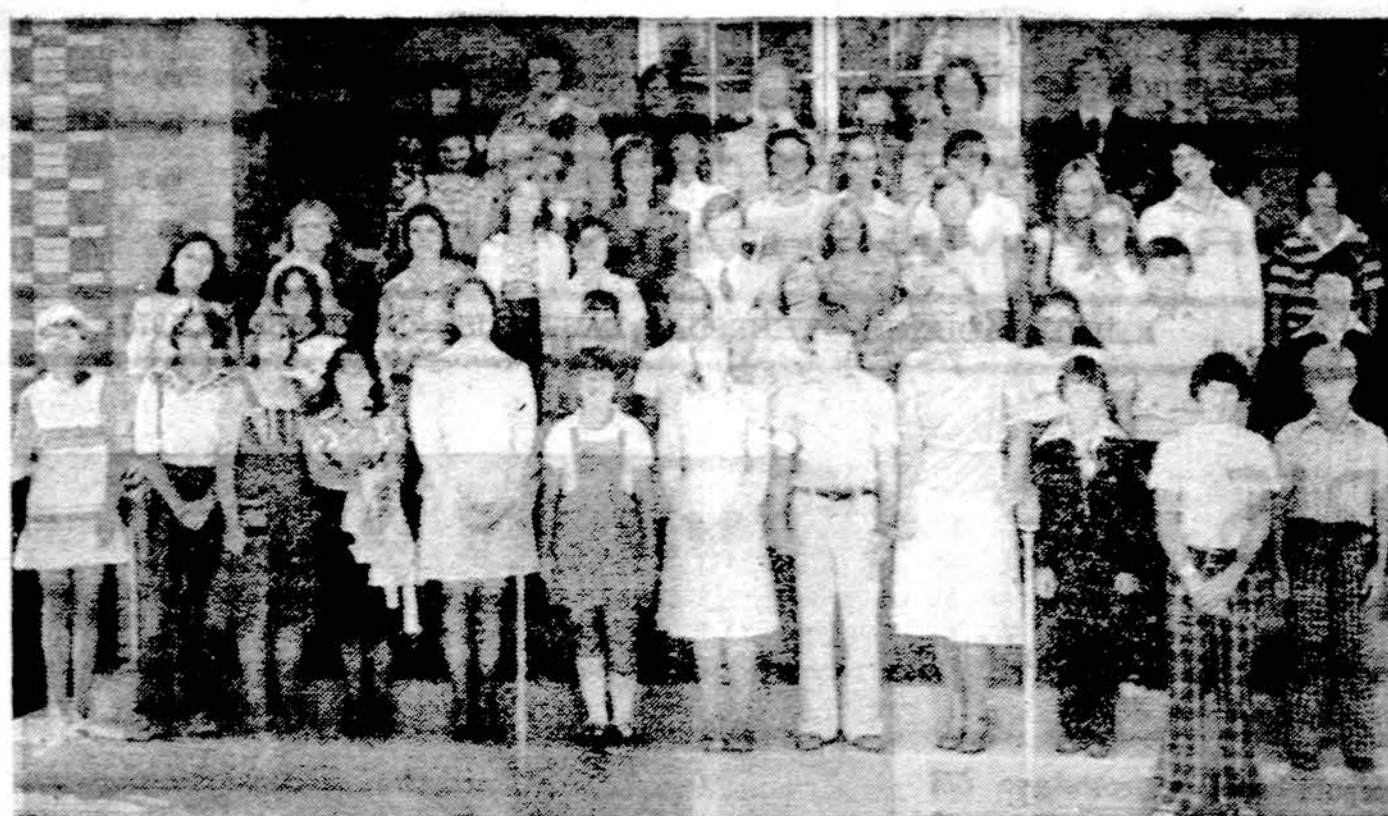
Jaunieji vyčiai, dalyvavę 63 Lietuvos vyčių seime, Dayton