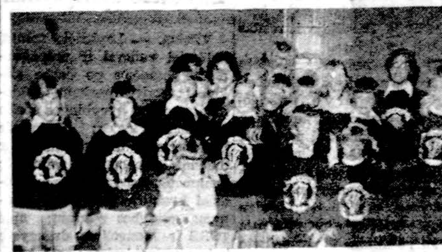
Dalis Detroito jaunūčių ateitininkų tradicinės rudens arbatėlės metu.