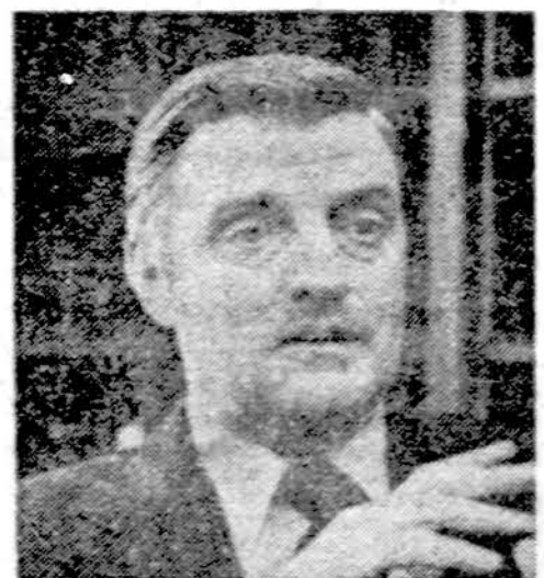
Walter Mondale, Minnesotos senatorius, išrinktas viceprezidento pareigoms

Neaiškumas iškilo dėl New Yorko balsų. Vos tik buvo paskelbta, kad laimėjo Carteris,