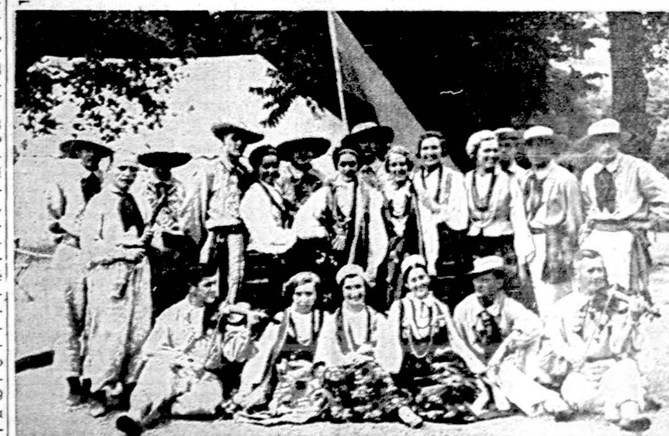
I-ji tautinių šokių grupė Kaune 1935m. vykusi į šokių festivalį Londone.