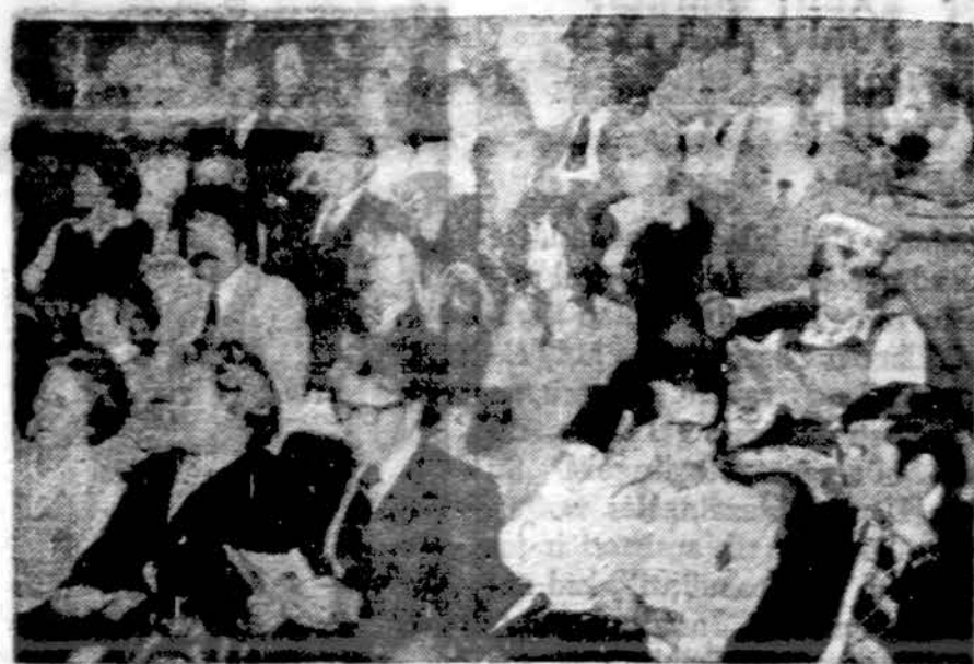
Clevelando Grandinėlių šokėjų programą seka Cuyohoga Community kolegijoj susirinkę svečiai.

GULF ASSOCIATES REAL ESTATE 6705 Gulf Blvd. St. Petersburg Beach, FL. 33706 Tel. 813-367-1791 diena arba 813-360-8744 vakara.