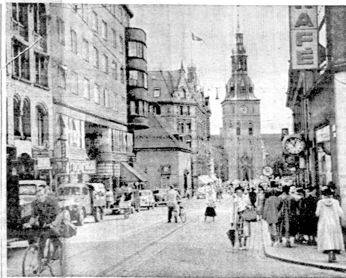
Oslo, Norvegijos sos tinės, prekybinė gatvė

Išėnas iš Senato Mike Mansfieldas, spėjama, gali būti pirmuoju ambasadorium Pekine. Jis sakęs ir norįs tų pareigų.