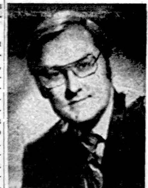
James R. Thompson, išrinktas Ilinojus gubernatorium didėle balsų dauguma

Kinų spaudos agentūra šia progą primena, jog sovietai pakartotinai pasisakė už neutraliųjų šalių iškeltą projektą paversti Indijos vandenyną taikos zona. "Iš tikrųjų — paremdami šį pasiūlymą, sovietai tesiekia amerikiečius priversti atitraukti savo karines bazes iš Indijos vandenyno srities ir patys šioje srityje įsivirtinti. Maskvos tikslas yra — taikos zoną Indijos vandenynne paversti sovietinio monopolio sritimi", rašo agentūra.