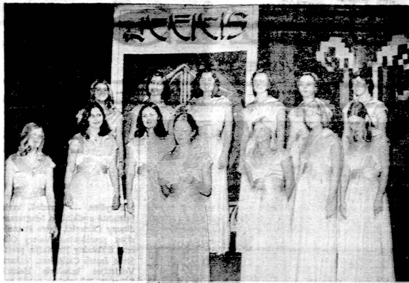
Nerijos choras, atvykęs iš Clevelando, atlieka programą "Ateities" žurnalo 65 metų sukakties minėjime, Jaunimo centre, Chicagoje