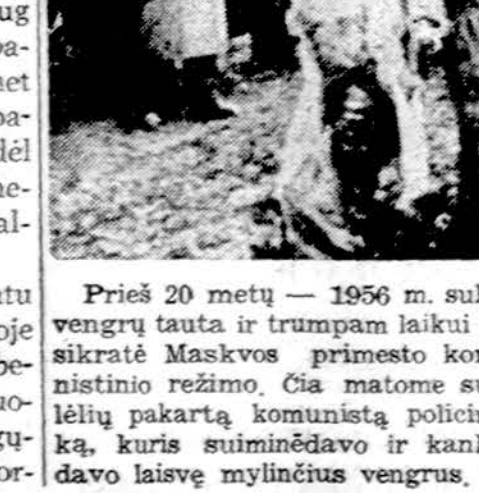
Prieš 20 metų — 1956 m. sukilo vengrų tauta ir trumpam laikui nusikratė Maskvos primesto komunistinio režimo...