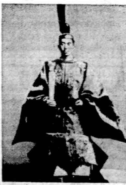
Japonijos imperatorius Hirohito šiomis dienomis atšventė 50 metų sukaktį nuo sosto perėmimo. Jo pirmoji nuotrauka po vainikavimo (1926)

Buvo kelios bylos. Yra žinoma, kad mažiausiai devyni asmenys nuteisti mirties bausme, dvi moterys gavo po 15 metų kalėjimo. Sužeistieji, surinkti gatvėse, buvo išvežti į karines ligonines ir iš jų niekada negrįžo, niekas nesužinojo, koks jų likimas. Jų, kaip ir užmuštųjų, šeimos buvo išvežtos į Sibirą. Išvežti ir visi fotografijoje atpažinti asmenys.