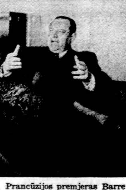
Prancūzijos premjeras Barre

Seimos irimas Seimos irimą galima apibūdinti tik keliais išoriniais požymiais. Pirmasis požymis — nepaprastas ištuokų padidėjimas. 1950 m. išsiskyrė 625, kai 1974 m. — 8346 seimos, taigi per ketvirtį amžiaus ištuokų skaičius padidėjo net 13 kartų su viršum. Ištuokos pablogina sunkias pragyvenimo sąlygas ir vaikų auginimą. Dalis išsiskyrusių šeimų tėvų nebeneri rūpinatis vaikų auginimu ir auklėjimu. 1975 m. dvigubai padidėjo teismuose bylų lyginant su 1970 m. dėl tėvų teisių atėmimo. Išsiskyrusios seimos vis dažniau savo vaikus iki 3 metų amžiaus atiduoda į kūdikių namus. Komunistų partijos vykdomas tikinčiųjų šeimų persekiojimas dorisškai pažeidžia net mokyklose besimokančius vaikus.