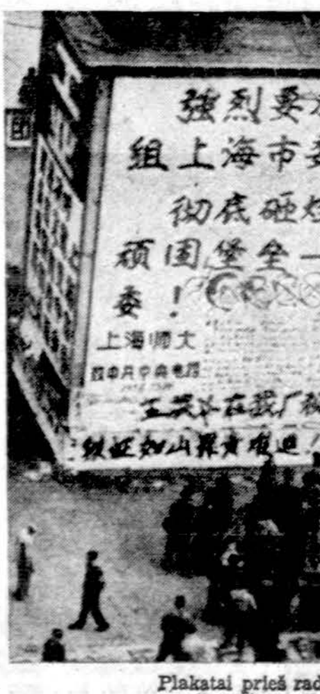
Plakatai prieš radikalus Šanchajuje

Roma. — Keturi tūkstančiai italų surengė demonstraciją, protestuodami prieš nutarimą iš kalėjimo paleisti nacių karininką Herbert Kepplerį, kuris liepė sušaudyti 335 italų už 32 vokiečių karių nužudymą. Keppler, 69 metų, serga vėžiu.