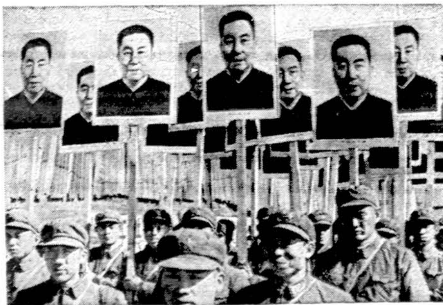
Kinijos armija pradeda garbinti naują vadą — Hua Kuo-fengą

New Delhi. — Ambasadorius William Saxbe, kuris šį šeštadienį palieka savo pareigas ir grįžta Amerikon, kritiškai atsiliepė ir apie Indijos skubėjimą kraštą paversti socialistine valstybe. "Tie, kurie advokatauja valstybinį socializmą, nieko neįmoko iš kraštų, kur toks socializmas praktikuojamas, kiek jis užmuša privačią iniciatyvą. Jei kas tenai ir buvo pasiekta, tai tik atskirų individų dėka". Skundžiasi Saxbe, kad per 21 mėnesį jam nepavyko indams išaiškinti ir įtikinti laisvų verslų pirmenybės prieš valstybės kontroliuojamus.