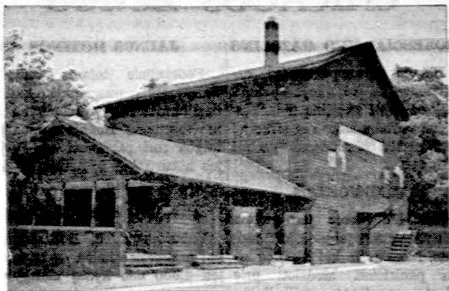
Franklin Cider malūnas