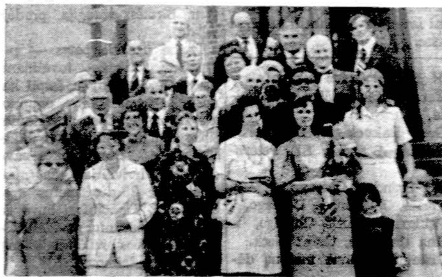
East St. Louis, Ill., lietuvių būrelis prie Nekalto Prasidėjimo par. bažnyčios po lietuviškų pamaldų rugsėjo 19 d.