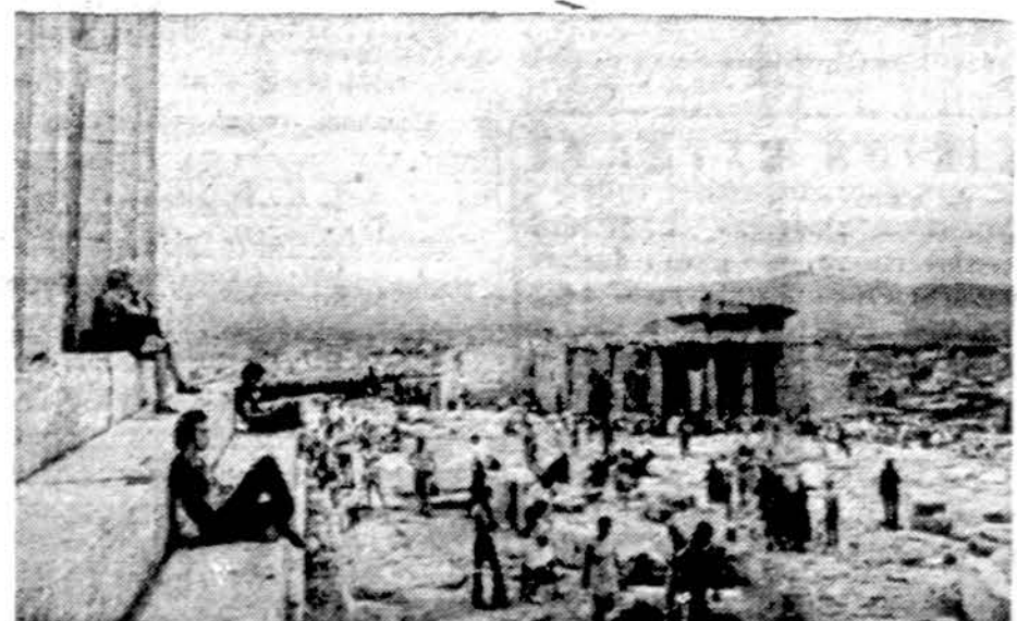
Ko nesunaikino laiko dantys, baigia naikinti civilizacijos pagimdytas jo užterštas ir minios turistų. Akropolio papėdėje, Atėnuose

Maskva. — Skyrybos didėja ir Sovietų Sąjungoj. Pagal 1974 metų statistiką Sovietijoje šimtųjų vedybų skyrybų buvo 28,52. Atskirose respublikose ar miestuose buvo žinomas toks procentas: Uzbekijoje buvo tik 12,3 skyrybų, kai Ukrainoje 31,7, Estijoje 38,6, Leningrade 42,8, Odesoje 53,3.