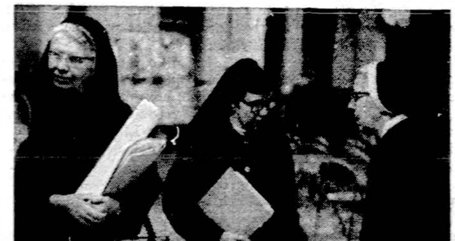
Seselės ALRKF kongrese, Chicagoje, kur buvo atstovaujama šešioms vienuolijoms.