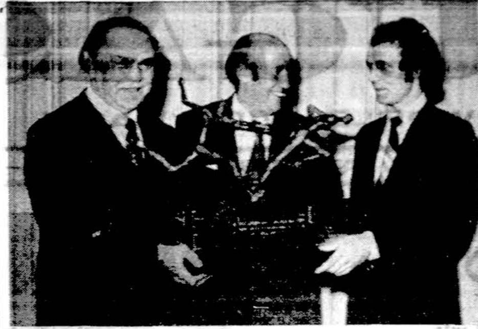
Max Schmeling, buvęs pasaulio bokso meistreris, Helmut Schoen, dabartinis Vokietijos futbolo rinktinės treneris, ir F. Beckenbauer, V. Vokietijos futbolo žvaigždė.

— Lietuvos pirmenybėse Ukmergės Vieniūnė nugalėjo Kauno Kelininką 2-1 ir išilankio pirmoje vietoje. Ją seka Alytaus Dainava ir Kėdainių Nevežis. — Rinkinyje šieuliai suaugę