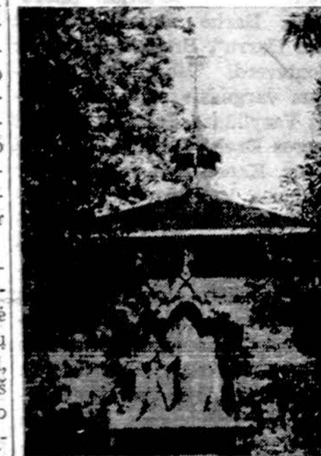
Gary lietuvių Šv. Kazimiero bažnyčia. Iš Jub. knygos viršelio