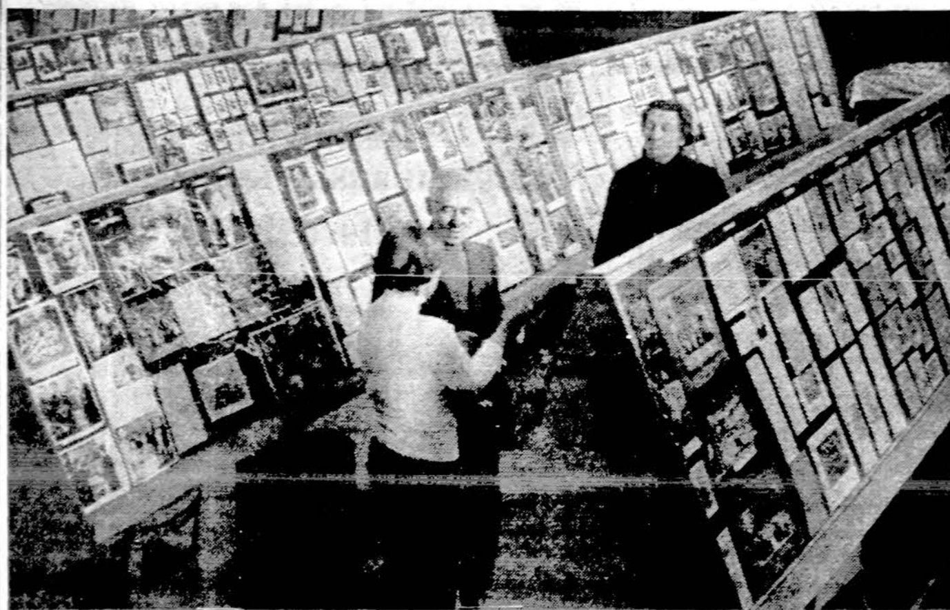
Senosios lietuvių išeivijos parodos vaizdas su būreliu rengėjų Apreiškimo par. salėje, Brooklyne, N. Y.

Ispanijos katalikų vyskupai bendrame dokumente pabrėžė religinio mokyimo svarbą mokyklose, kartu nurodydami tavy, auklėtojų ir visų krikščionių pareigą rūpintis jaunimo katekizacija. Vyskupai pažymi, jog ir valstybė privalo pilnai paremti krikščionių pastangas šioje srityje. Valstybė privalo sudaryti tokias sąlygas, kuriose visi pakrikštytieji galėtų mokykloje gauti tinkamą religinį auklėjimą. Šalia šeimos, mokykla yra tinkamiausia vieta religinių tiesų perteikimui vaikams. Ispanijos katalikų vyskupai, be to, pažymi, jog niekas kitas, o tik tėvai turi teisę auklėti vaikus.