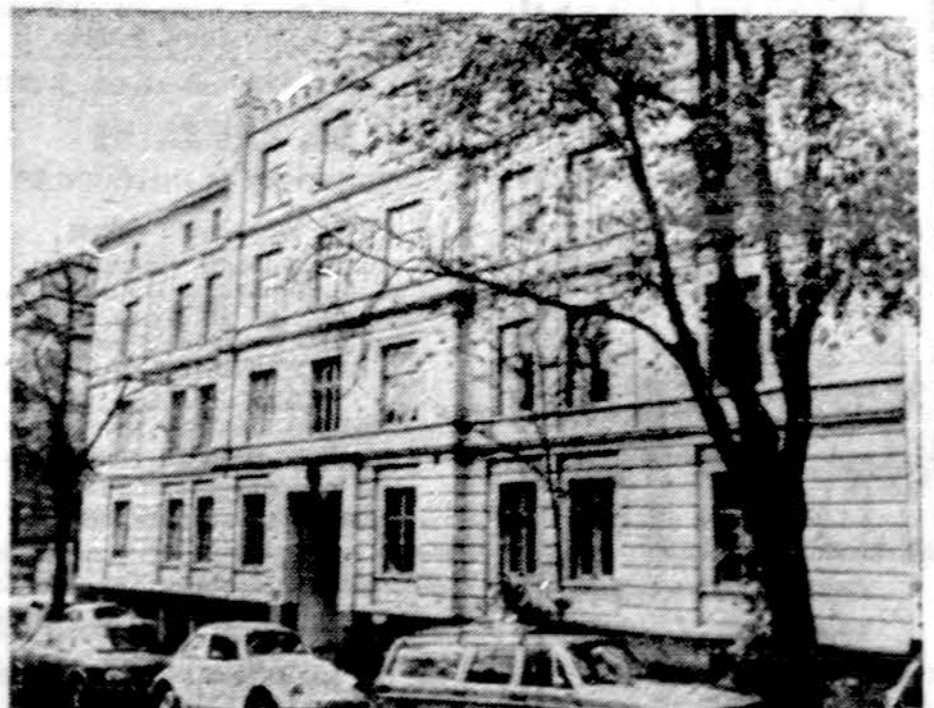
Dabar tie rūmai tušti. Šlaurės Korėjos ambasada Oslo mieste. Už narkoti- kų, likerių ir tabako kontrabandą Norvegijos vyriausybė visus korejiečius išvarė

Pekinas. — Kinai išsprogdino šiais metais ketvirtą ir didžiau- sią vandenilio bombą. Išsprog- dino atmosferoje, ir radioakty- vios nuosėdos gali pasklisti pla- čiai pasauly, pasiekti Amerikos teritoriją.